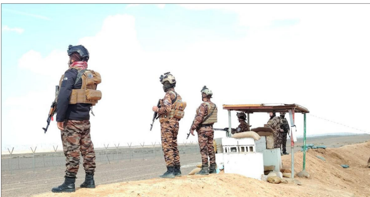
قوات عراقية تنتشر على الحدود مع سوريا