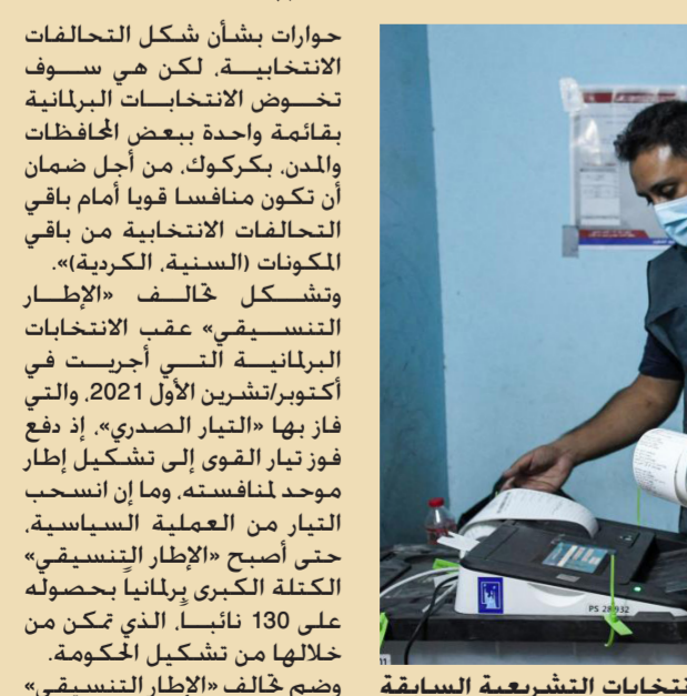
من الانتخابات التشريعية السابقة

متابعة - الصباح الجديد: أدان المجلس الأوروبي أحداث العنف التي شهدتها الساحل السوري الأسبوع الماضي. وأوضح في بيان، أمس الثلاثاء، أن المفوضية الأوروبية وسوريا التي تمثلت بوزير خارجيتها أسعد الشيباني، «تدينان بشدة الأعمال الانتقامية التي استهدفت المدنيين من قبل مجموعات مسلحة». كما دعنا لجنة التحقيق الدولية التابعة للأمم المتحدة إلى التحقيق في أحداث العنف الأخيرة. كذلك أدان الرؤساء المشاركون ووزير الخارجية السوري الهجمات العنيفة التي شنها «فلول نظام الأسد» على قوات الأمن، ورفضوا أي استغلال للوضع السوري من قبل أي جهة حكومية أو غير حكومية، بما في ذلك التلاعب بالمعلومات.