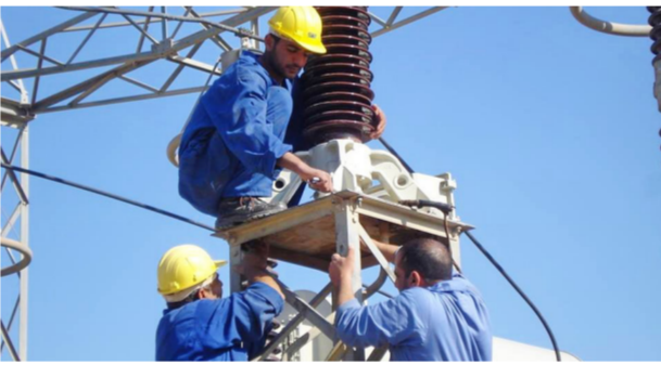
ميجاواط يومياً. بعد أن كانت 1000 ميجاواط. فيما توقع مصدر عراقي آخر لمنصة «الطاقة»، بأن يكون هذا المشروع الإجمالي الأسبوع الماضي إلى 700

بغداد - الصباح الجديد : كشفت وزارة الكهرباء، أمس الإثنين، عن مصير 3 مشروعات طاقة ترمب في إيران. مع تصاعد حملة الرئيس الأمريكي، دونالد ترامب، تجاه طهران. وكان ترامب أعلن الإغفاء الممنوح للعراق باستيراد الكهرباء والغاز من إيران، ضمن عقوبات جديدة. تستهدف تقليص إيرادات الخزنة الإيرانية، وأعاد مصدر بوزارة الكهرباء، في تصريحات لمنصة «الطاقة»، أن مشروع استيراد الغاز التركيمنستان عبر إيران، لا يزال قيد التنفيذ. دون أي اعتراض من أمريكا». وقال المصدر، أن «سداد مستحقات الغاز المستورد سيكون لتركمناستان، وليس إيران، ومن ثم لا معنى لاتهام بغداد بتحويل خزينة طهران».