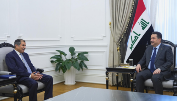
خلال اللقاء، التطلع نحو تعزيز أواصر التعاون بين البلدين.

الثنائي البناء في مجالات عدة، مشيراً إلى الفرص المتاحة، وتوفير البيئة الاستثمارية الملائمة لعمل الشركات العربية والأجنبية، ومنها الشركات الكويتية. ونقل البيان عن السوداني، قوله إن الباب مفتوح أمام دولة الكويت للدخول في مشاريع طريق التنمية، والاستفادة من الفرص الاستثمارية المعلنّة، بما يساهم في تعزيز التكامل الاقتصادي وترباط المصالح بين البلدين.