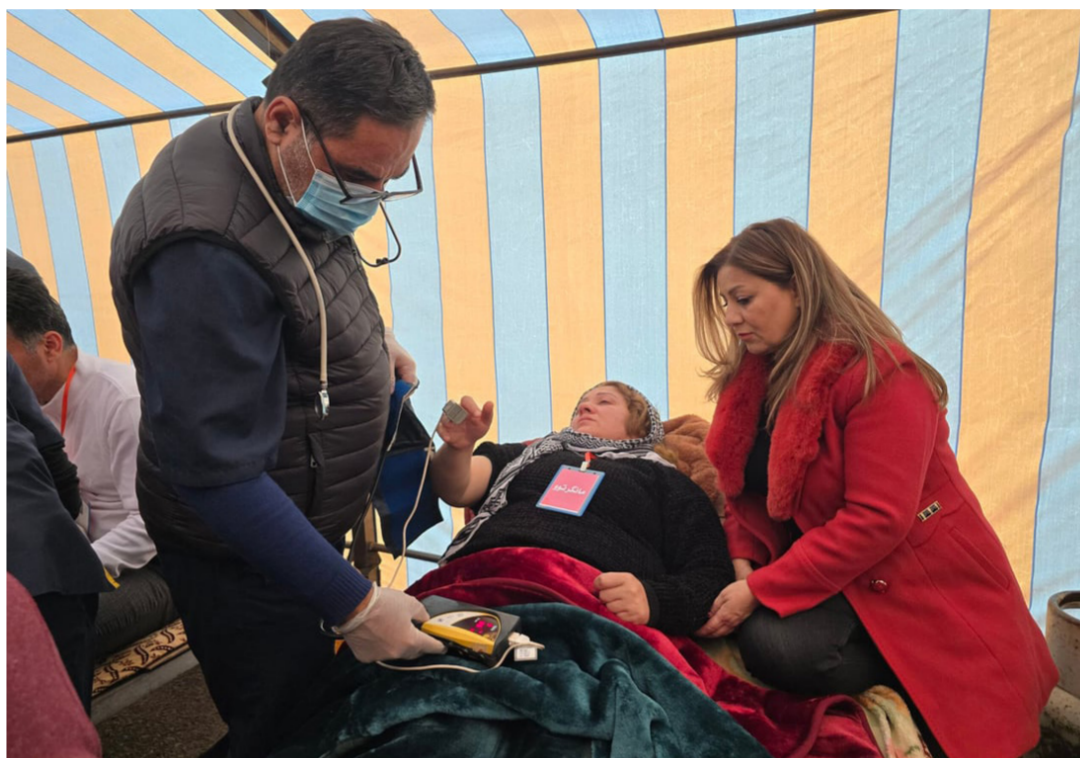
تدهور حالة المضرين عن الطعام في السليمانية