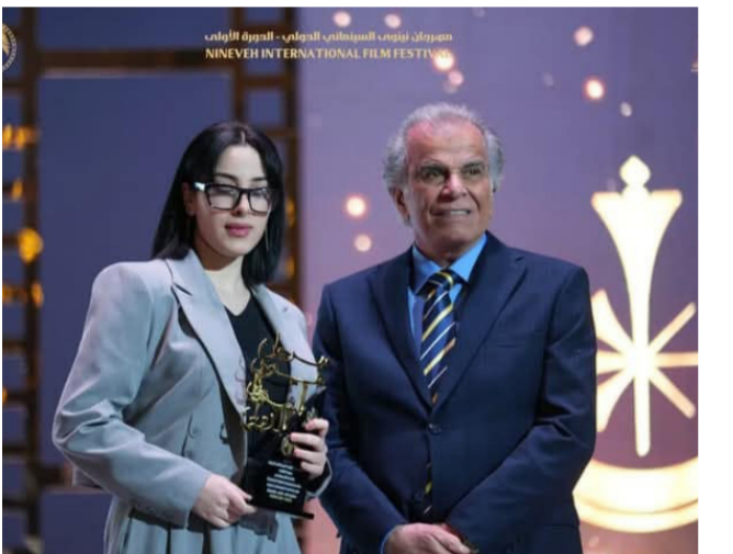
مهرجان نينوى السينمائي

إن تحقيق رؤية السوداني فيما يخص تمكين المرأة في القيادة لا يتوقف عند حدود السياسات والخطابات الرسمية. بل يستلزم تطبيقاً فعلياً على أرض الواقع. مدعوماً بإرادة سياسية قوية وآليات تنفيذية واضحة. فتمكين المرأة لا يعني فقط منحها مناصب قيادية، بل يقتضي توفير بيئة تشريعية خمي حقوقها. إلى جانب سياسات اقتصادية واجتماعية تتيح لها التقدم دون قيود أو معوقات مجتمعية. وفي هذا السياق، لا يمكن إغفال الدور المحوري الذي تلعبه المؤسسات التعليمية والإعلامية في تغيير الصورة النمطية عن المرأة ودورها في القيادة. فالإعلام، بوصفه سلطة مؤثرة، قادر على إعادة تشكيل الوعي المجتمعي حول أهمية مشاركة المرأة في مراكز القرار بعيداً عن الخطاب التقليدي الذي يحصر دورها في أطر محدودة. كما أن المناهج التعليمية بحاجة إلى تطوير يعزز قيم المساواة ويقدم نماذج قيادية نسوية ناجحة لتحفيز الأجيال القادمة. على الجانب الآخر، لا بد من الإشارة إلى أن نجاح أي مشروع لتمكين المرأة في العراق مرهون بقدرته المجتمع على تجاوز التحديات السياسية والاقتصادية التي تلقي بظلالها على الجميع. رجالاً ونساءً. فاستقرار الدولة وعموماً الاقتصادي يساهم في خلق فرص أكبر للنساء سواء في القطاع العام أو الخاص. ويمنهن القدرة على إثبات كفاءتهن في مواقع المسؤولية. ختاماً، يمكن القول إن رؤية السوداني لتمكين المرأة تمثل خطوة جادة نحو تحقيق توازن حقيقي في المشهد القيادي العراقي. لكنها تحتاج إلى دعم مستمر من مختلف القوى الفاعلة لضمان ترجمتها إلى واقع ملموس. فالمرأة العراقية، التي أثبتت قدرتها على مواجهة التحديات في مختلف المجالات، تستحق أن تكون شريكاً حقيقياً في صنع القرار. لا استثناءً مشروطاً بظروف سياسية أو اجتماعية.