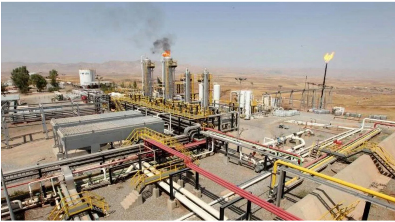
حقل نفطي في كردستان