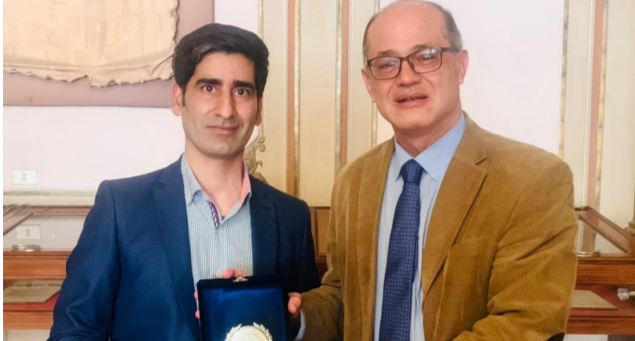
مجاللات الأدب والفنون، وحققت تأثيراً كبيراً في المشهد الثقافي الفني العربي.

وأكد النعيمي "قدرة الموسيقي العراقي على التأثير والإلهام عالياً، كما يعكس التقدير العميق لدوره في الحفاظ على الهوية الثقافية العربية وتطويرها بما يتماشى مع تحديات العصر". وأشار إلى أن "جائزة النيل للمبدعين العرب التي يمنحها المجلس الأعلى للثقافة في مصر من أرفع الجوائز العالمية في العالم العربي، التي تهدف إلى تكريم الشخصيات التي قدمت إسهامات متميزة في