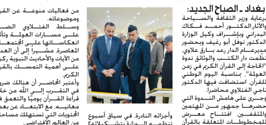
وأجرائه الندوة في سياق أسبوع تنظيمه الوزارة بتشكيلاتها

من فعاليات متنوعة عن القرآن وموضوعاته. وسلط الفلاني الضوء على مسارات العولمة وتأثير انعكاساتها على المجتمعات المعاصرة، مشيراً إلى أن العديد من الآيات والأحداث النبوية ركزت على أهمية التمسك بالقرآن الكريم. وأعتبر المحاضر أن هنالك ضرورة في التفريق إلى الله من خلال قراءة القرآن يومياً والتعمق في معانيه مع الابتعاد عن بعض المحتويات التي تستهلك مساحات من العالم الافتراضي.