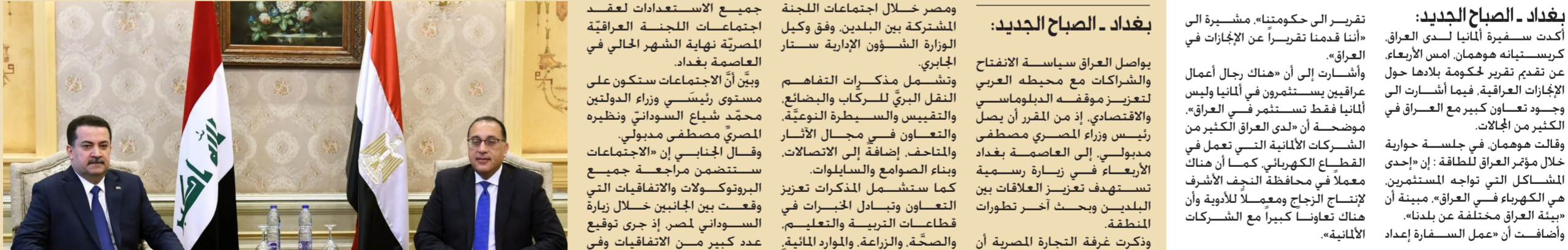
رئيسا الوزراء العراقي والمصري (إرشيفية)