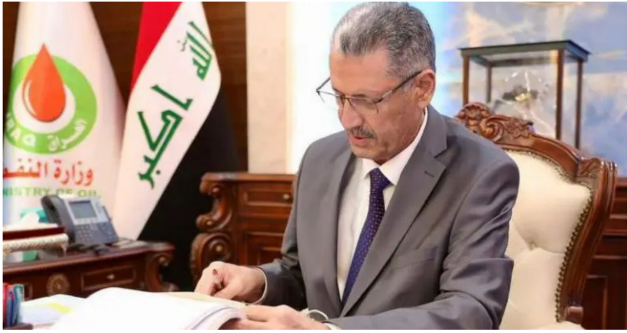
وزير النفط حيان عبد الغني

وأشار إلى أن «جميع الإجراءات الشكلية والموضوعية المتعلقة بالاستجواب قد تم الانتهاء منها مؤكداً «مفاجأة» وزارة النفط بالاستجواب وإنشعار الوزير به وبين الكرعاوي. أن «الدستور