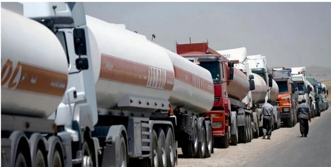
تهريب نفط كردستان .. أزمة مستمرة وسط عدم الالتزام بتسليم الإيرادات

المشمولين بشبكة الرعاية الاجتماعية». وتابع نوري، أن «كميات كبيرة من النفط يهربها الإقليم إلى خارج العراق وهذا الأمر لم ينته لغاية الوقت الحالي، وبأسعار بخسة بالتعاون مع الشركات العاملة هناك»، ودعا نوري، إلى «اتخاذ تدابير مستمرة وسط عدم الالتزام بتسليم الإيرادات الخالية من وسائل الإعلام بأن هذه تصريحات غريبة لا تمت إلى المطروح حاليا في مجلس النواب على قانون الموازنة خصوصا توقف الانفلات الحاصل في الملف المالي والنفطي داخل إقليم كردستان».