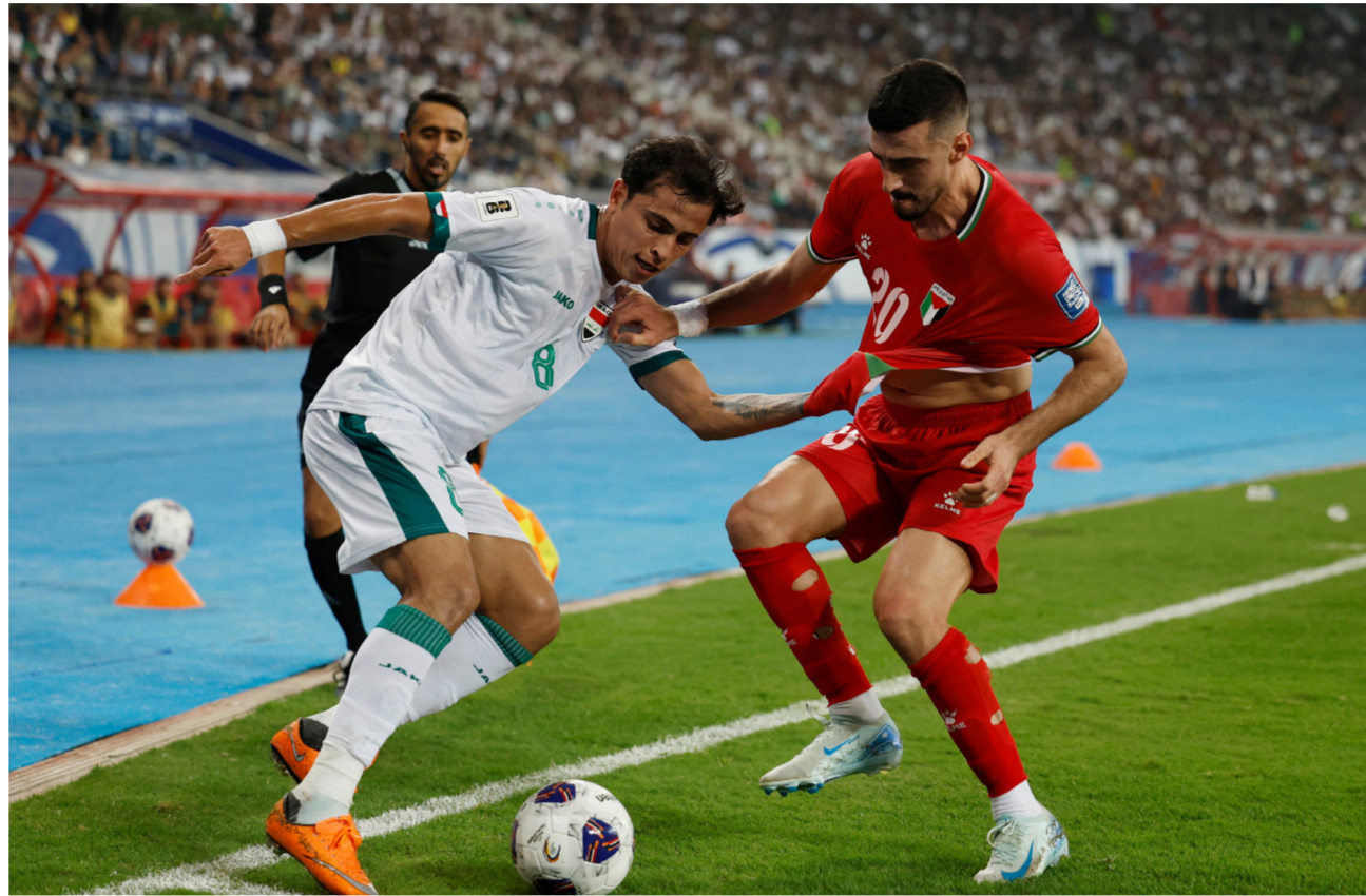
بغداد- الصباح الجديد:

يوضح الاتحاد العراقي لكرة القدم أن الاتحاد الدولي لكرة القدم (FIFA) طالب الاتحاد الفلسطيني لكرة القدم بإقامة مباراة المنتخب الفلسطيني أمام منتخبنا الوطني ضمن الجولة الثامنة من تصفيات المجموعة الآسيوية الثانية المؤهلة لنهائيات كأس العالم 2026 بغير ملعب (فيصل الحسيني الدولي) بمدينة رام الله الفلسطينية حيث أكد (FIFA) على إقامة مباراة منتخبنا الوطني ومستضيفه الفلسطيني في ملعب محاييد. على أن لا يكون ضمن ملاعب منتخبنا دول المجموعة الثانية. كما يؤكد الاتحاد العراقي لكرة القدم أن ما تناولته عدد من وسائل الإعلام مؤخراً بخصوص تحديد ملعب المباراة هو غير صحيح تماماً. ولا يمت للحقيقة بصلة ويأمل الاتحاد العراقي لكرة القدم من جميع المواقع والمنصات الإلكترونية والوكالات توحى الدقة في نقل المعلومة في هذه الفترة بالتحديد. كونها مهمة ومؤثرة. ويتطلب من الجميع مساندة المنتخب الوطني العراقي ودعمه