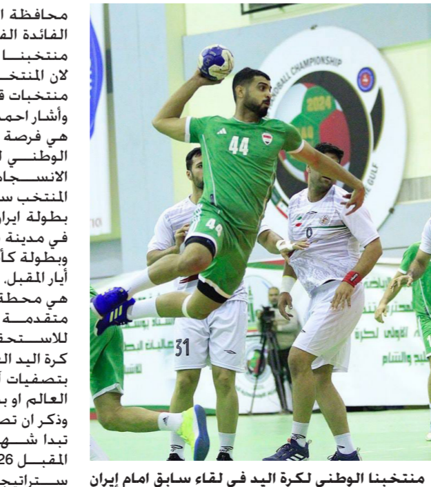
منتخبنا الوطني لكرة اليد في لقاء سابق امام إيران

محافظة النجف مؤخرا. وأشار إلى الفائدة الفنية التي كسبها لاعبي منتخبنا من المبارتين في النجف. لان المنتخب الإيراني يعد احد ابرز منتخبات قارة آسيا باللعبة. وأشار احمد إلى ان المباريات التجريبية هي فرصة لتعزيز إمكانات المنتخب الوطني لكرة اليد وزيادة عنصر الانسجام بين لاعبين سيميا وان المنتخب سيكون احد المشاركين في بطولة ايران الدولية المقررة ان تقام في مدينة شيراز شهر اذار المقبل. وبطولة كأس العرب في تونس شهر أيار المقبل. وتابع ان المباريات التجريبية هي محطة مهمة لمواجهة منتخبات متقدمة في كرة اليد استعدادا للاستحقاقات المقبلة التي تنتظر كرة اليد العراقية كما في المشاركة بتصفيات آسيا المؤهلة إلى كأس العالم او بطولة العرب وغيرها. وذكر ان تصفيات اسيا مقررا لها ان تبدأ شهر كانون الثاني من العام المقبل 2026. وان اخاد كرة اليد وضع استراتيجية منتظمة لمواصلة اعداد