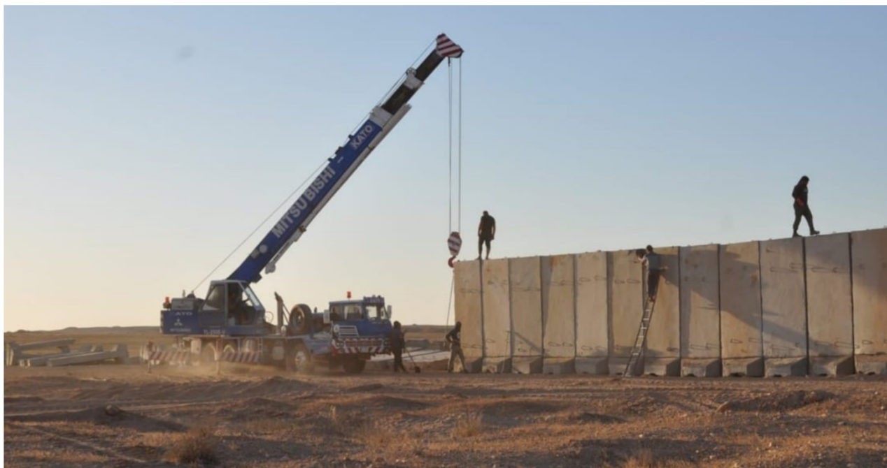
الحدود السورية العراقية

الأحداث السورية الأخيرة، مبيّن أن «ملف الحدود يعدّ الأكثر أمناً منذ العام 2003، وأن الإجراءات الأمنية المشددة المتخذة من قبل الجانب العراقي والجانب السوري غير مسبوق». وقد أسهمت بتطور أمن الحدود بشكل واضح، وأكد أن «تعزيز أمن الحدود بوحدات عسكرية إضافية، والتوجيهات الصارمة من قبل القيادات العليا والمتابعة المباشرة من قبل رئيس الوزراء انعكست بشكل واضح على أمن الحدود». مشيراً إلى أن «سورية وعلى مدى السنوات التي مضت كانت مصدراً لتسلسل العناصر الإرهابية من وإلى العراق وعمليات التهريب خاصة الخدرات».