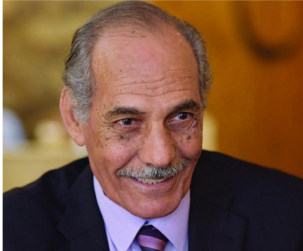
أحمد خلف (1943 - 2025)

نعي الاتحاد العام للأدباء والكتاب في العراق القاص والروائي القدير أحمد خلف، حيث جاء في البيان الذي أعلن بعد ساعات من وفاته: "ينعى الاتحاد العام للأدباء والكتاب في العراق القاص والروائي أحمد خلف، الذي فارق الحياة الاثنين 6 كانون الثاني 2025، في بغداد، تاركا تاجا أدبيا كبيرا ومهما."