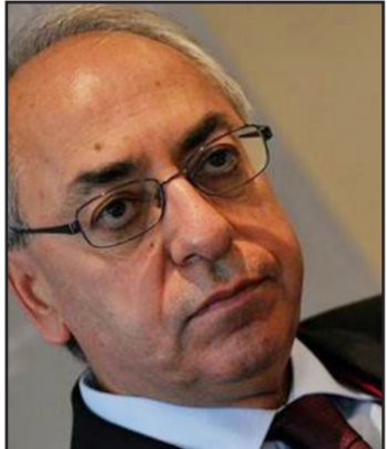
عبد الباسط سيدا

ولد عبد الباسط سيدا عام 1956 في مدينة عامودا بحفاظة الحسكة ذات الغالبية الكردية، ويُعد من المجموعة الأولى التي عملت على تأسيس المجلس الوطني السوري في الثاني من تشرين الأول 2011، وكان عضواً في المكتب التنفيذي للمجلس ورئيس مكتب حقوق الإنسان فيه، وانتخب في العاشر من حزيران 2012 رئيساً للمجلس الوطني السوري المعارض.