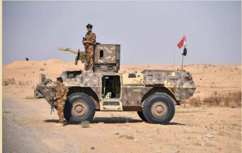
جنديان عراقيان عند نقطة حراسة على الحدود مع سورية

عسكري في سوريا عندما كان بشار الأسد لا يزال رئيساً. وأرسلت قوات إضافية إلى البلد لتعزيز مهمة دحر داعش». كما أضاف أن الجنود الإضافيين بمثابة قوات مؤقتة أرسلت لدعم مهمة محاربة تنظيم داعش. والاسبوع الماضي، شدد نائب مستشار الأمن القومي الأميركي، جون فاينر، على أن قوات بلاده ستبقى في سوريا بعد سقوط نظام الرئيس بشار الأسد، في إطار مهمة لمكافحة الإرهاب تركز على تدمير تنظيم «داعش».