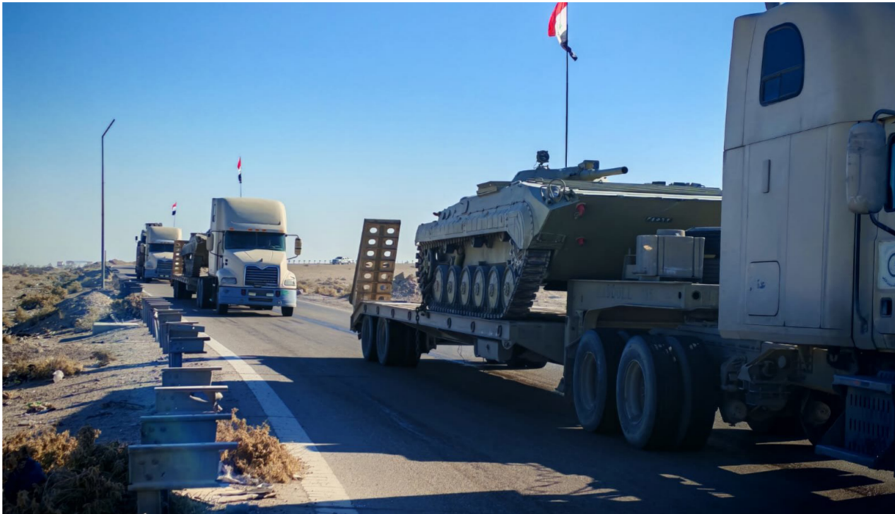
الجيش العراقي يحرك قطعاً مدرعة باتجاه الحدود مع سوريا

بجري ذلك في وقت وجهت فصائل المعارضة السورية التي تقود هجوماً في سورية ضد نظام بشار الأسد، الأحد، رسالة إلى الحكومة العراقية لطمانتها، وجاء في الرسالة: «نحن في حكومة الإنقاذ تطمنن الحكومة العراقية والشعب العراقي التيقن بأن سورية لن تكون مصدراً للقلق أو التوتر في المنطقة. على العكس من ذلك، فإننا ملتزمون بتطوير وتعزيز علاقات التعاون الأخوي مع العراق لضمان استقرار المنطقة وتحقيق المصالح المشتركة لشعبينا».