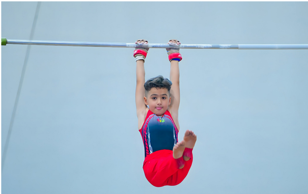
الجمبار .. تؤسس لقاعدة واسعة

وقال ان الحفاظ على التدريبات واستمراريتها وتواصل اللاعبين الموهوبين بتشجيع الإدارة والمدربين والمتابعة الدؤوبة لأهالي اللاعبين هي نقاط أساسية لصناعة أبطال في عالم الجمبار. وكذلك كيفية تطور اللاعب بمستواه الفني والعمل يوما بتوجيهات المدربين وتأدية التدريبات بشكل صحيح هذا يرتقي بالاداء المهاري ويضع إلى امكان اعداد لاعبين جديين في الأجهزة المعتمدة في رياضة الجمبار.