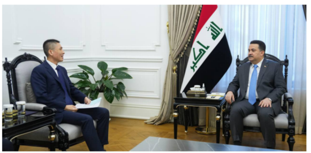
السوداني والسفير الصيني يبحثان العلاقات الثنائية بمختلف المجالات

بما يحقق المنفعة المتبادلة والمصالح المشتركة بين البلدين الصديقين».