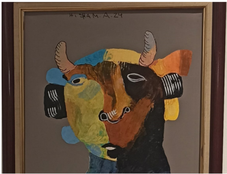
من أعمال الفنان هشام الحبيب

فمفناك في ولاني مأهول بك لن أطفاك ألا برحيق لاهب ستسعى إليه لاهنا وأنت... متحفم بالاشتياق