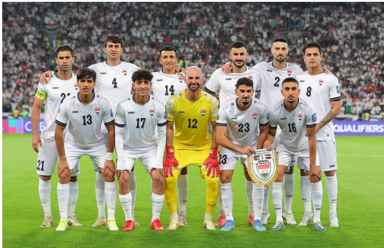
المنتخب الوطني في طريقه لمعسكر الدوحة