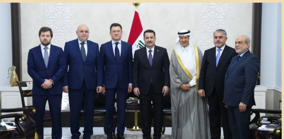
السوداني ونائب رئيس الوزراء الروسي ووزير الطاقة السعودي

بغداد - الصباح الجديد: عقدت في الرياض اجتماع رفيع المستوى ضم رئيس الوزراء العراقي مصطفى الكاظمي ونائب رئيس الوزراء الروسي ميخائيل بوغدانوف ووزير الطاقة السعودي الأمير فهد بن سلطان آل سعود. حضر الاجتماع ممثلون من الجانبين العراقي والسعودي والروسي. وأكد الكاظمي أن «العراق والسعودية وروسيا لديهم فرص كبيرة للتعاون في مجال الطاقة». وأضاف الكاظمي أن «العراق والسعودية وروسيا لديهم فرص كبيرة للتعاون في مجال الطاقة».