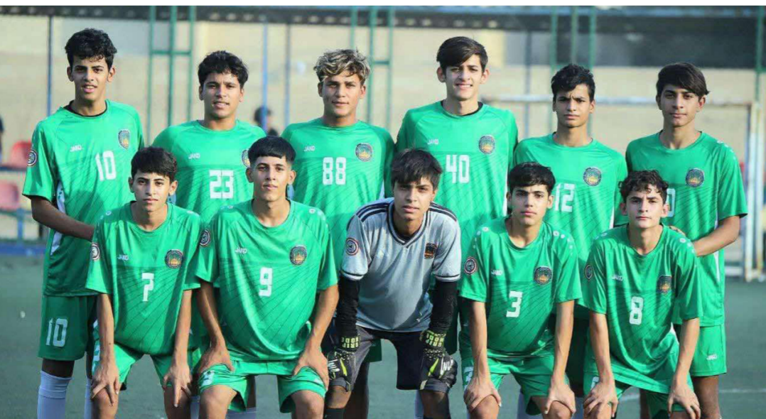
ناشئة نادي الحسين بكرة القدم