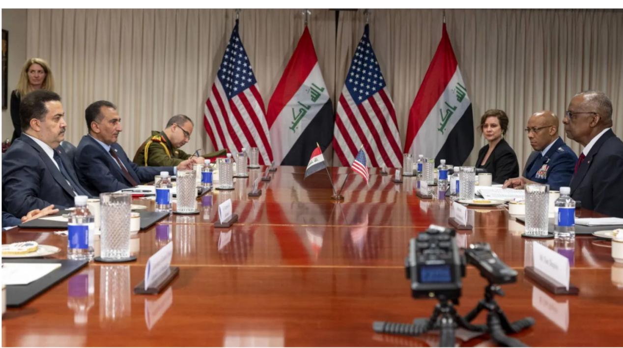
رئيس الوزراء في لقاء سابق مع وزير الدفاع الأمريكي لويد أوستن في البنغازين

التهديدات ضدنا». من جانبه. ذكر الخبير الأمني أحمد الشريفي في حديث مع «الصباح الجديد» أن «التصريحات التي تصدر من الحكومة عن إنهاء هجمات الفصائل المسلحة لن تكون كافية ما لم تتخذ وسائل للردع. مع منع اختراق الأحزاب للمؤسسات الأمنية والعسكرية».