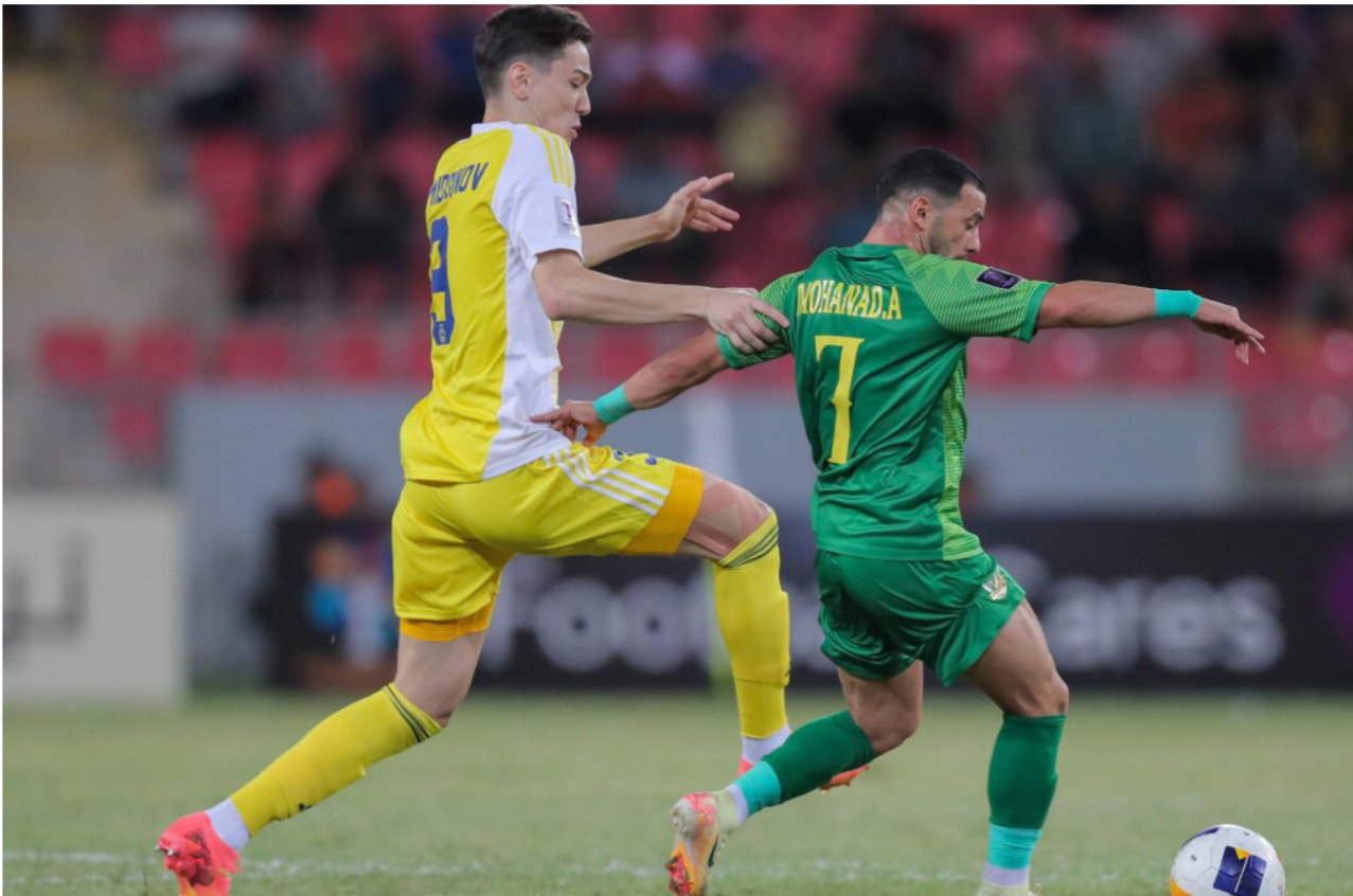
الشرطة امام باختاكور في ابطال آسيا للنخبة

تقام في الساعة 7 من مساء اليوم ملعب كربلاء الدولي مباراة فريقي الشرطة وضيفه الوصل الإماراتي لحساب الجولة الخامسة من مباريات دوري أبطال آسيا للنخبة بكرة القدم. ويقف الشرطة في الترتيب 11 ما قبل الأخير في لائحة فرق البطولة لمجموعة الفرق بنقطتين. إذ تعال في اللقاء الأول امام النصر السعودي بهدف لثله في ملعب المدينة الدولي ثم خسر امام الهلال السعودي في جدة بخمسة اهداف من دون رد وتعادل امام باختاكور الأوزبكي سلبا في ثالث مباراته بكربلاء وعاد ليخسر بخمسة اهداف لهدف امام الأهلي السعودي في جدة في الجولة الرابعة. وفي دوري أبطال الخليج للنادية، يضيف فريق دهوك في الساعة 8 من مساء اليوم الثلاثاء ضيفه فريق النصر الإماراتي ضمن الجولة الثالثة للمجموعة الأولى من بطولة دوري أبطال الخليج. وسبق لدهوك ان فاز بهدفيين نظيفين على فريق اهلي صنعاء اليمني ملعب دهوك في الجولة الأولى ثم تعادل بهدف لثله امام ظفار العماني في ملعب الأخير. ويلعب دهوك في المجموعة الأولى ضمن البطولة التي تضم في المجموعة الثانية فرق الاتفاق السعودي والعربي القطري والقطرية الكويتية والرفاع البحريني. من جهة أخرى، تقام اليوم الثلاثاء ضمن الجولة الثامنة من المرحلة الأولى لدوري نجوم العراق بكرة القدم مباريات النجف ونفط