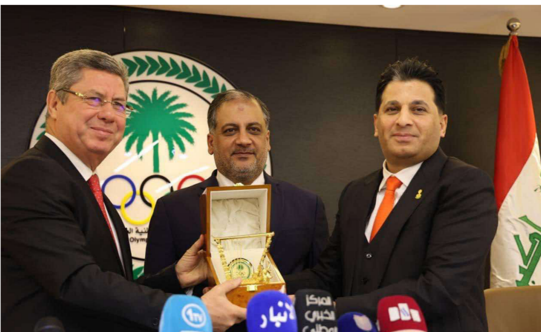
جانب من توقيع الاتفاقية بين الأولمبية ونظيرتها التونسية