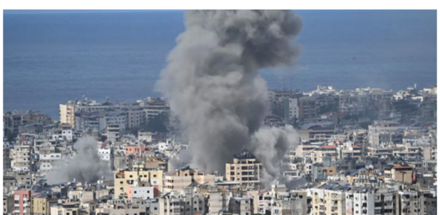
جانب من الممار جراء غارة إسرائيلية استهدفت منطقة في بيروت من جنوب لبنان. وذكرت وسائل إعلام عبرية أن فرنسا ستستضم إلى آلية مراقبة التفاهات التي تم التوصل إليها.

والتي تشمل انسحاب حزب الله إلى ما وراء الليطاني، وفتح السلاح في جنوب لبنان، وحرية العمل للجيش الإسرائيلي في حالة حدوث انتهاكات، من المتوقع تحقيق المزيد من التقدم الكبير فيما يتعلق بالاتفاق في الساعات المقبلة». وأكد أن «الاتفاق جاء في اللحظة الأخيرة ومعناه أن فرنسا ستكون على الأرجح جزءاً من الآلية التي من المتوقع أن تراقب التفاهات التي يتم التوصل إليها في إطار الاتفاق».