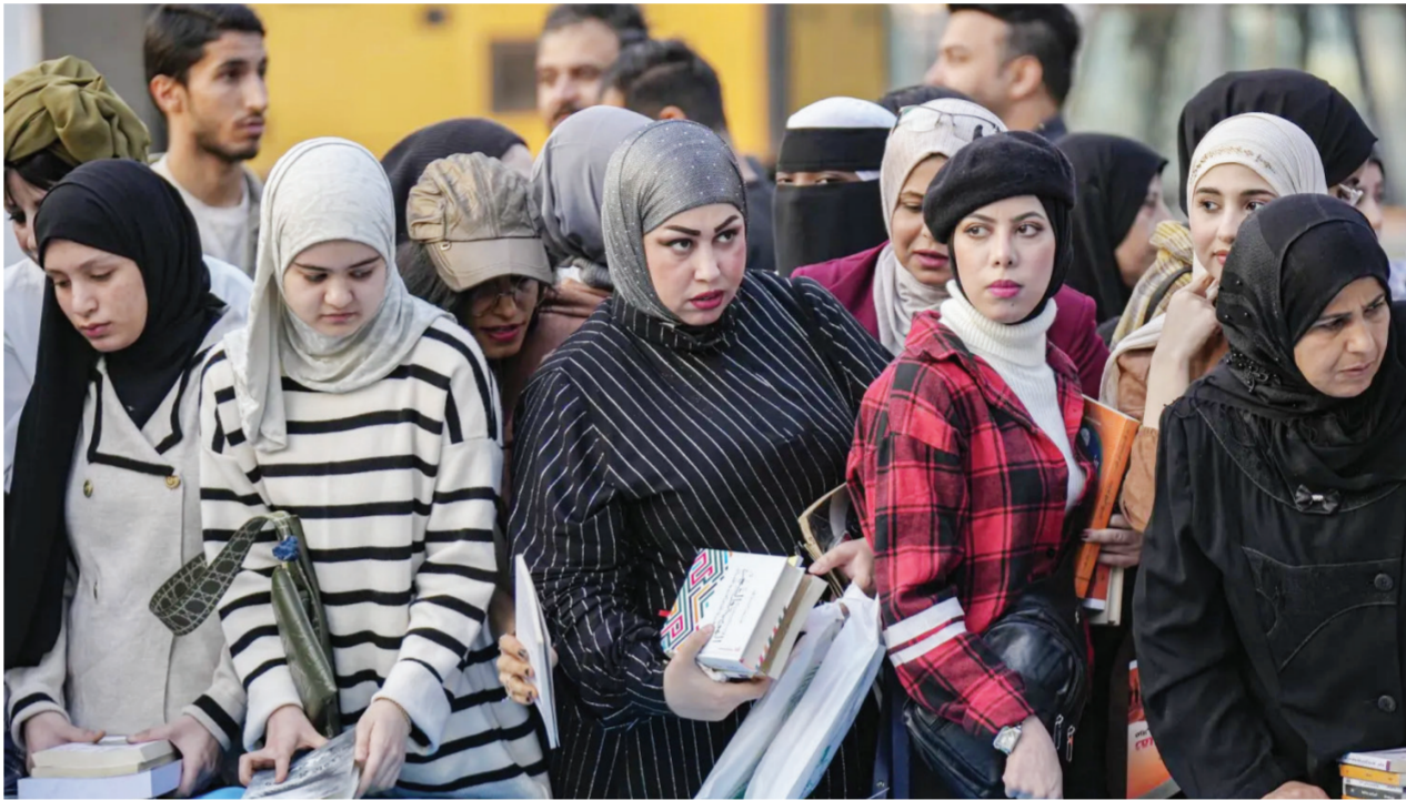
عراقيات في معرض الكتاب ببغداد

يزيد عدد سكان العراق على 45 مليون نسمة، نحو نصفهم من النساء، وثلثهم تقل أعمارهم عن 15 عاماً. وفق ما أعلن رئيس الوزراء محمد شياع السوداني، أمس الاثنين، حسب الأرقام غير النهائية لتعداد شامل هو الأول منذ عقود. وأجرى العراق الأسبوع الماضي تعداداً شاملاً للسكان والمساكن على كامل أراضيه لأول مرة منذ 1987، بعدما حالت دون ذلك حروب وخلافات سياسية شهدتها البلد متعدد العرقيات والطوائف. وقال السوداني، في مؤتمر صحفي: «بلغ عدد سكان العراق 45 مليوناً و407 آلاف و895 نسمة، من ضمنهم الأجناب واللجوء، وتوه بان الأيسر التي ترأسها النساء تشكلت 11.33 في المائة» بالبلد، حيث بلغ «عدد الإناث 22 مليوناً و623 ألفاً و833 بنسبة 49.8 في المائة» وفق النتائج الأولية للتعداد. ووفق تعداد عام 1987، كان عدد سكان العراق يناهز 18 مليون نسمة. وشمل تعداد السنة الحالية المحافظات العراقية إلى 18، بعدما استثنى تعداد أجري في 1997. المحافظات