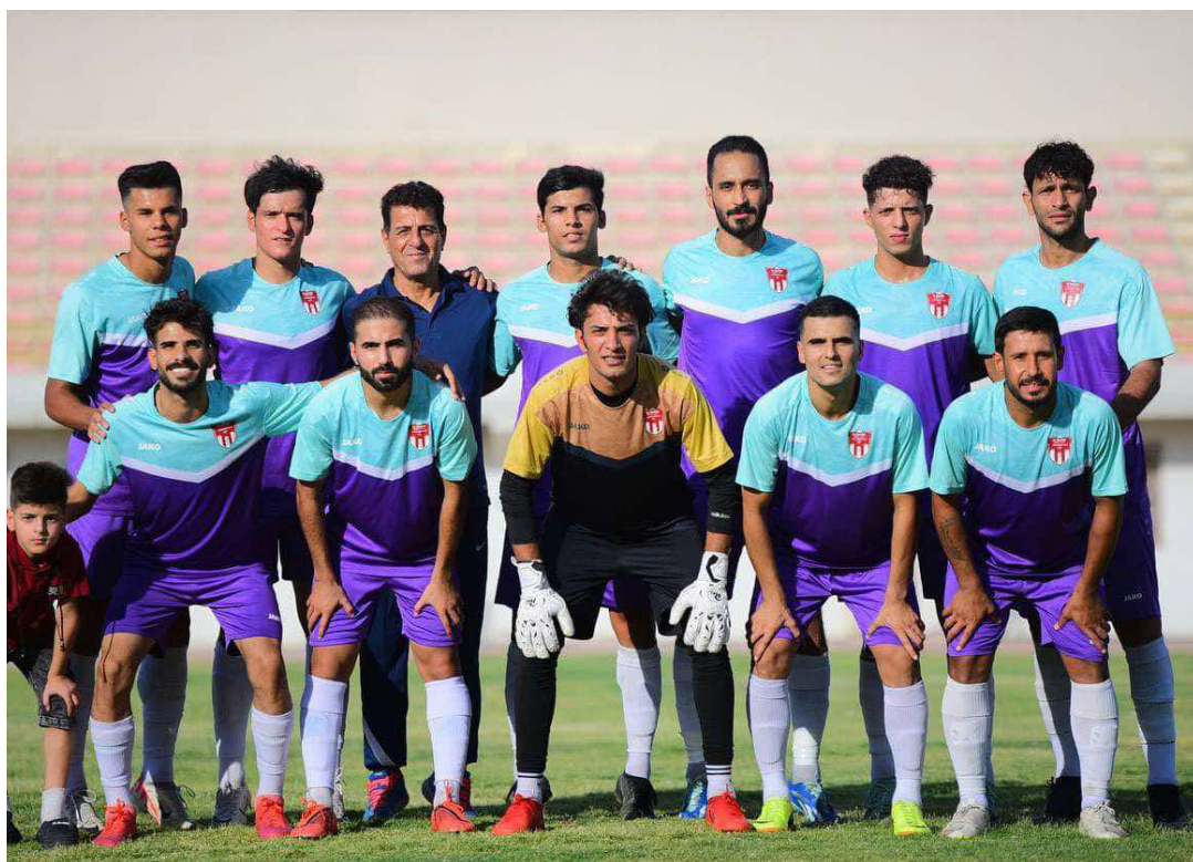
فريق نادي الصليخ

اللاعبين في الملعب، وأشار إلى انه قام ببناء فريق جديد بتشكيلة متكاملة لكرة الصليخ بعد ان حل الفريق السابق، وهذا أخذ منه وقتاً من جانب الاختيار ثم الاختبار للوقوف على الأفضل من اللاعبين. وتابع ان الفريق بدأ تدريباته في شهر أيلول الماضي، ثم دخل أجواء المباريات التجريبية التي حقق فيها الفوز على الأمواج الموصلية بهدف وعلى السماوية بهدف أيضاً وعلى الخالص بهدفين وتعليقاً وبالنتيجة ذاتها على فريق ريف الطلبة وأيضاً على الكفيل وعلى الجوهرة بثلاثية نظيفة وتعادل امام التجارة سلباً من دون أهداف وامام فريق الحسين بهدفين لخطلهم، في حين خسرها امام الجيش ودبالي بهدف من دون رد توالياً وامام أمانة بغداد والطلبة والنفط بهدف مقابل هدفين توالياً.