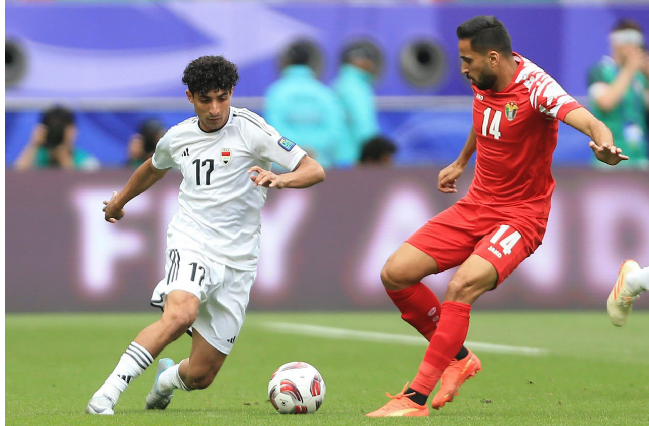
العراق والا دن في لقاء سابق