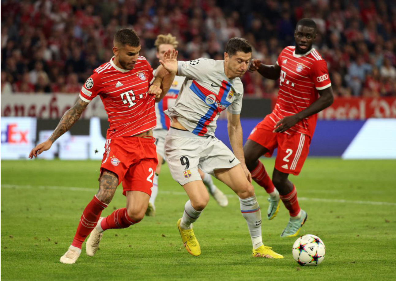
برشلونة وبايرن ميونخ في لقاء سابق

كلوب على مواجهة ليفربول ولايزيج. اليوم الأربعاء ضمن الجولة الثالثة من المجموعة الموحدة لمسابقة دوري أبطال أوروبا، حيث يصطدم الماضي الفريد المدير الفني الألماني الجديد بمهمته الجديدة. وعُتِمَ كلوب مديرا لعمليات كرة القدم في ريد بول التي تملك أندية لايزيج وسالزبورج ونيويورك. بعد تخلي المدرب (57 عاما) عن