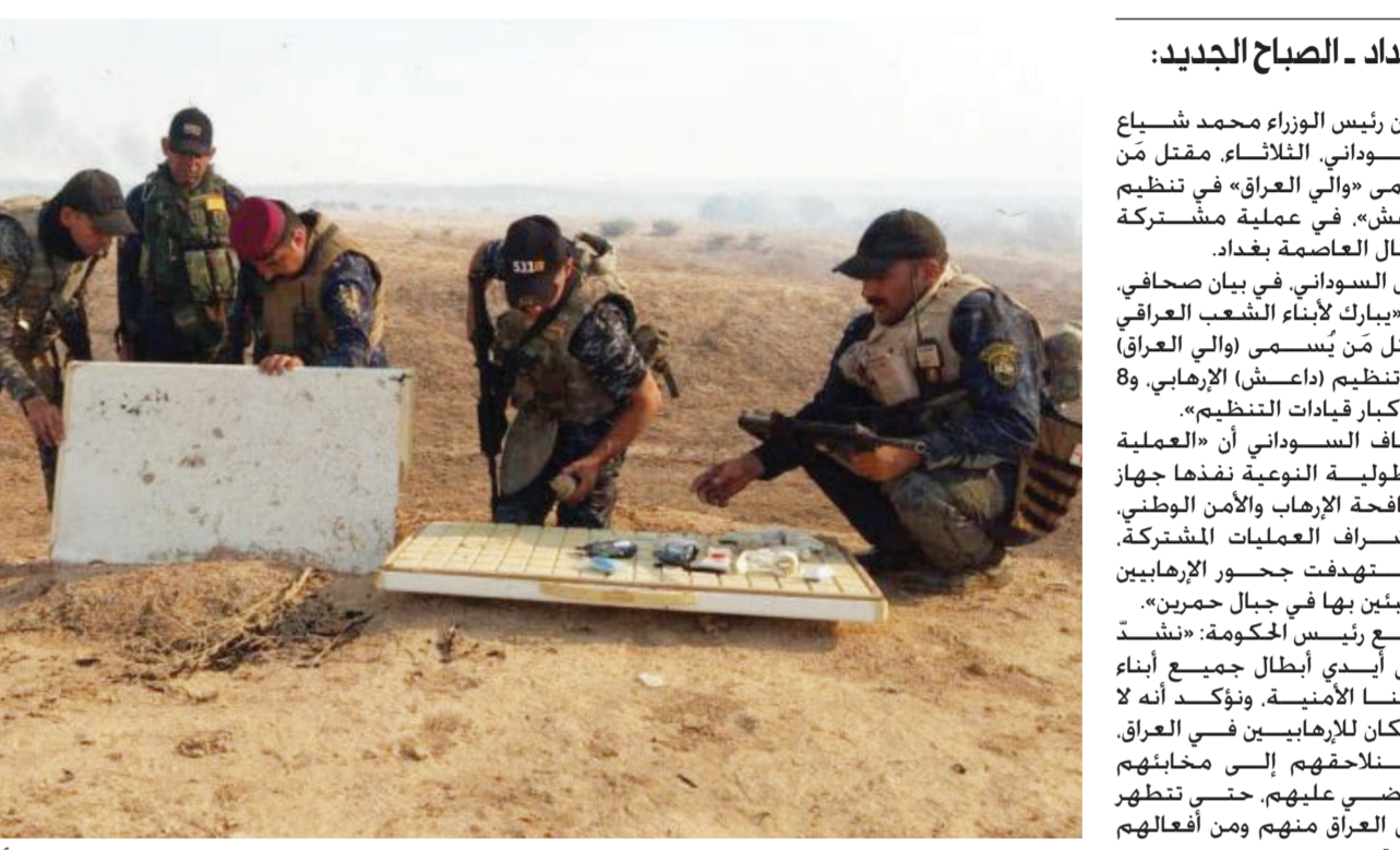
العثور على مخبأ لداعش خلال العملية الأمنية

بغداد - الصباح الجديد: أعلن رئيس الوزراء محمد شياع السوداني، الثلاثاء، مقتل «والي العراق» في عملية مشتركة شمال العاصمة بغداد. وقال السوداني، في بيان صحفي، إنه «يبارك لإنشاء الشعب العراقي مقتل من يُسمى (والي العراق) في تنظيم (داعش) الإرهابي، و8 من كبار قيادات التنظيم». وأضاف السوداني أن «العملية البطولية النومية نفذها جهاز مكافحة الإرهاب والأمن الوطني، وبإشراف العمليات المشتركة، واستهدفت جحور الإرهابيين الختئين بها في جبال حمرين». وتابع رئيس الحكومة: «نشأت على أيدي أبطال جميع أبناء قواتنا الأمنية، ونؤكد أنه لا مكان للإرهابيين في العراق، وسنلاحقهم إلى مخابئهم ونقضى عليهم، حتى تظهر أرض العراق منهم ومن أفعالهم الأثمة».