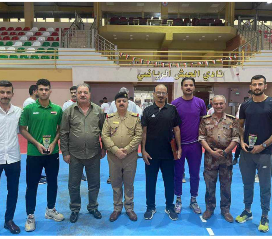
العاب القوى في نادي الجيش .. نتائج متقدمة

بمنافسات شديدة من اجل الحصول على نتائج متقدمة ستبهر الأخوة المسؤولين في النادي وكذلك المتابعين لعروض الألعاب .)