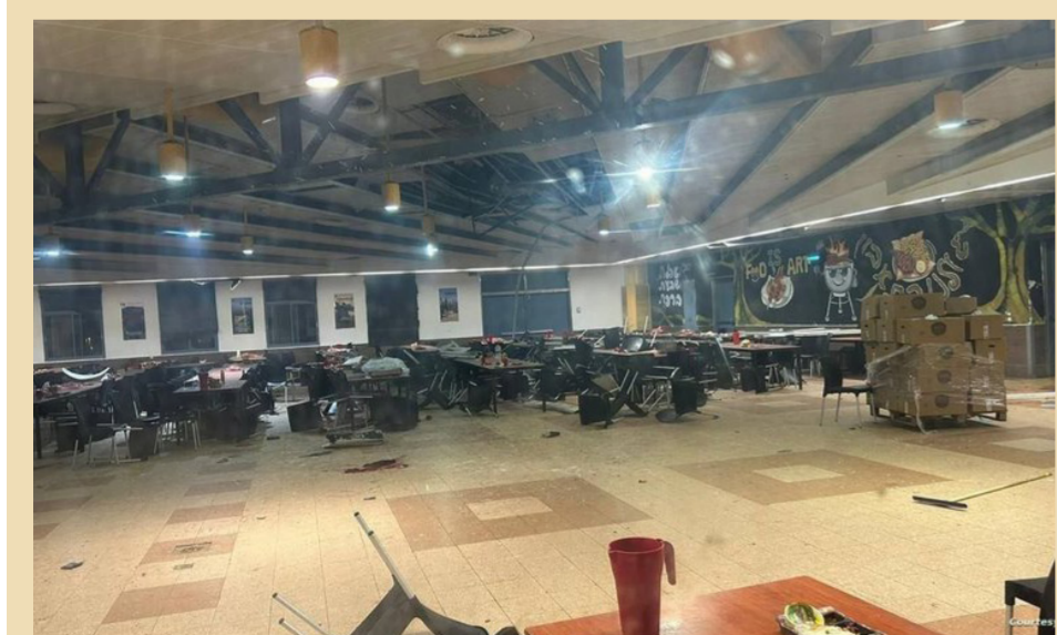
الهجوم استهدف مطعمًا داخل قاعدة عسكرية في بنيامينا جنوب حيفا

منطقة بنيامينا جنوب مدينة حيفا. وقال المتحدث باسم الجيش الإسرائيلي. هرتسي هالي. في حديثه لوسائل إعلامية. أن الهجوم كان «صعباً ومؤلماً». وأعلن الجيش الإسرائيلي. ليل الأحد الاثنين. عن مقتل أربعة من جنوده في «هجوم بمسيرة» اخترقت الأجواء من الأراضي اللبنانية وفتحت في قاعدة تدريب عسكرية «قرب مدينة بنيامينا وسط البلاد». واعتبر رئيس أركان الجيش الإسرائيلي. هرتسي هالي. في حديثه لوسائل إعلامية. أن الهجوم كان «صعباً ومؤلماً». وقال هالي في حديثه لوسائل إعلامية. أن الهجوم كان «صعباً ومؤلماً». وقال هالي في حديثه لوسائل إعلامية. أن الهجوم كان «صعباً ومؤلماً».