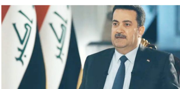
على دعوة الحكومة العراقية في 2014 وحقق بمساعدة العراق

الصباح الجديد - وكالات: قال رئيس مجلس الوزراء محمد شياع السوداني. الأحد. إن كل ما يطرح إليه هو خدمة العراقيين ووضع العراق أولاً في سياستنا الحكومية. وذكر السوداني في مقابلة مع سي إن إن الأمريكية. أن «الحكومة العراقية التزمت أمام مجلس النواب بإعادة ترتيب العلاقة مع التحالف الدولي لمحاربة داعش الإرهابي. وبين أن «التحالف الدولي تشكل بناءً