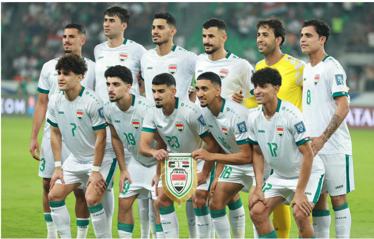
المنتخب الوطني لكرة القدم

الكوري لكونه لعب ضد بعض منتخبات مجموعتنا. واعتقد هذا كان من صالح العراق حتى يتم خديد نقاط الضعف لديهم وفي الوقت نفسه المنتخب الكوري الجنوبي شاهده في أداء متصاعد بين مباراة وأخرى. وبرغم ذلك، فإننا نطمح في حصول منتخبنا على نتيجة إيجابية أما ما قدمه منتخبنا أمام نظيره المنتخب الفلسطيني بكل صراحة كان أداءً متواضعاً. وليس كما عهدنا منتخبنا قديم اللعب الجيد خصوصاً في أرضه وبين جماهيره واعتقد أن مباراة منتخبنا مع الأردن في الجولة المقبلة بالبصرة الشهر المقبل ستكون هي كلمة الفصل من تأهل منتخبنا إلى كأس العالم أو من عدمه.