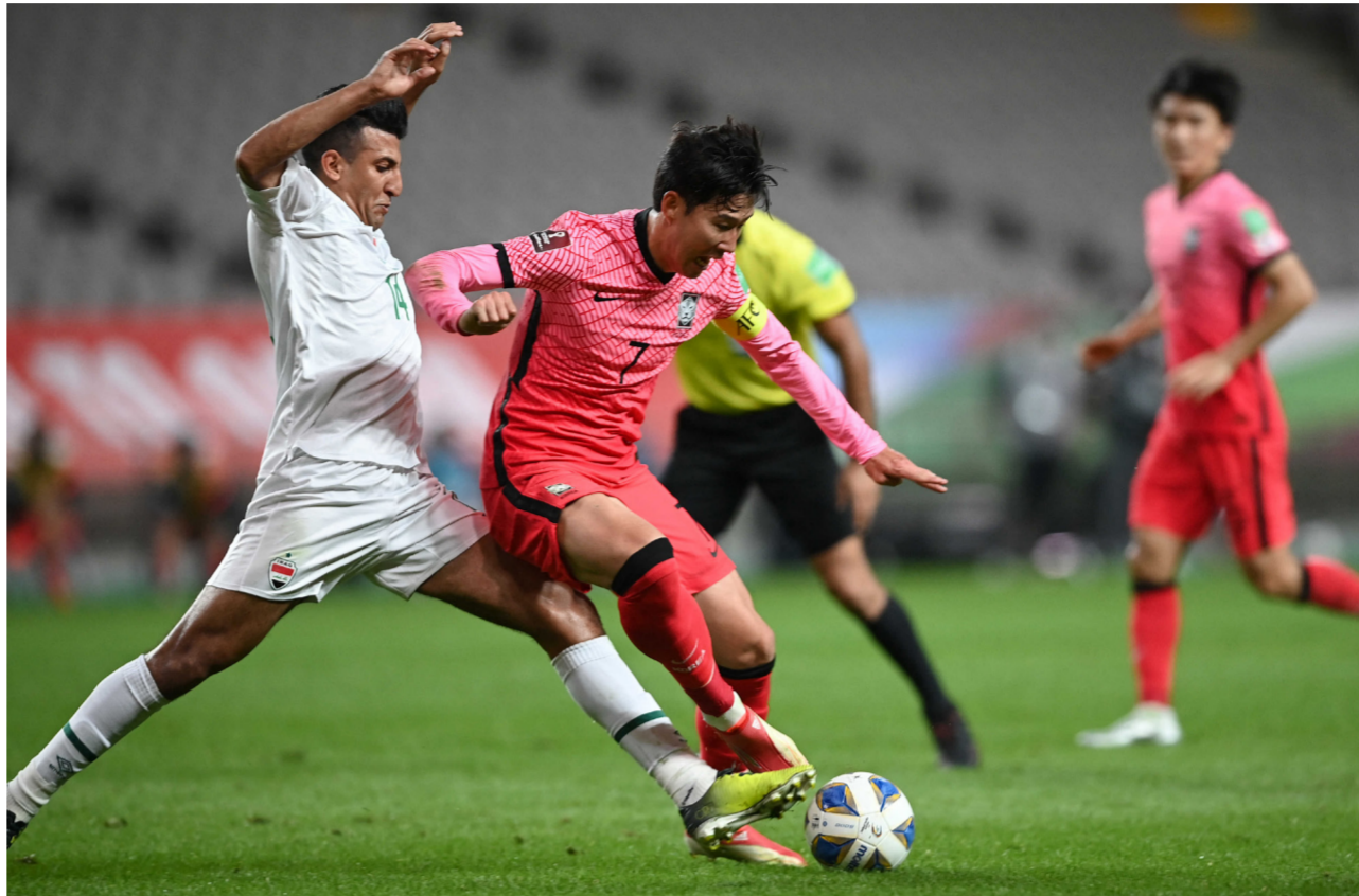
العراق ضد كوريا الجنوبية في لقاء سابق