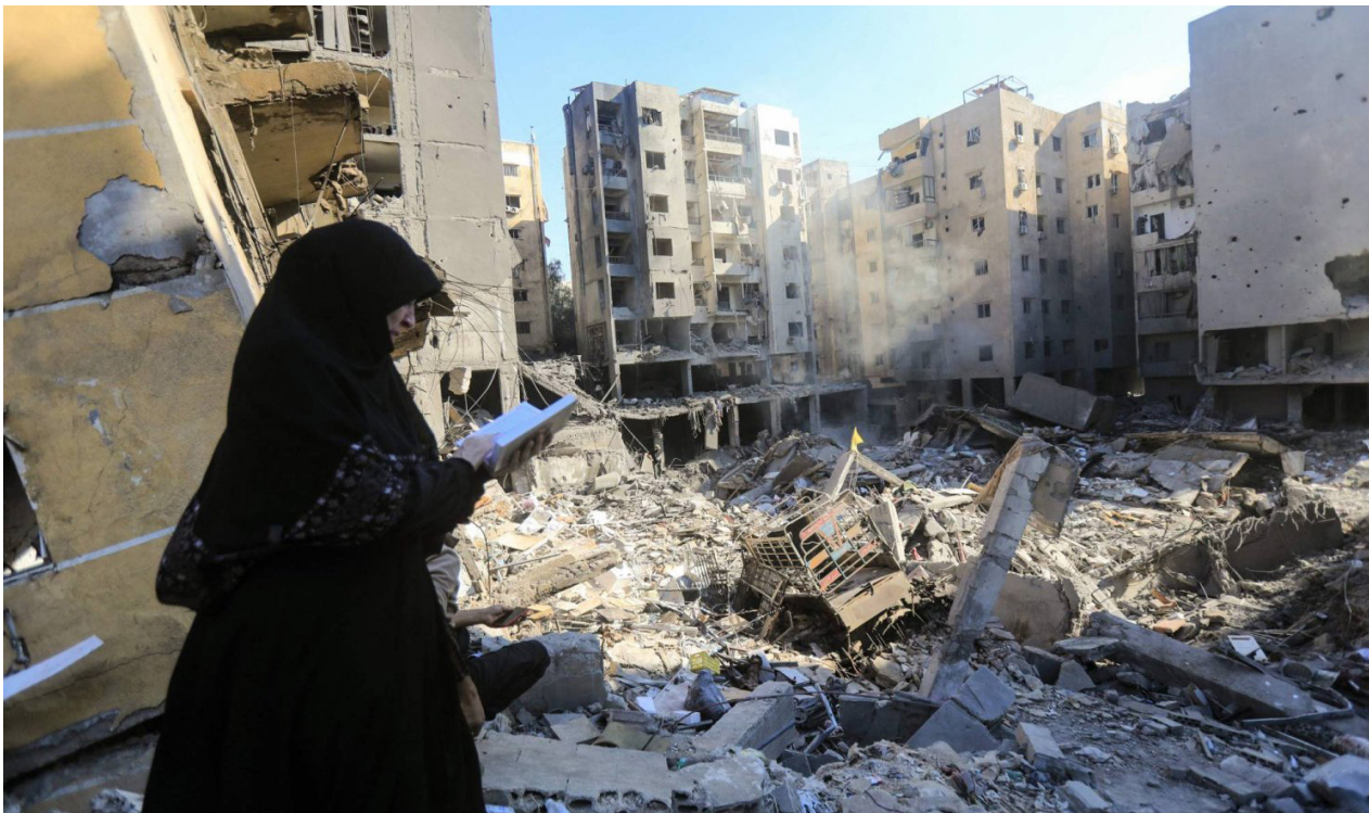
امرأة تقرأ القرآن على موقع اغتيال نصر الله بالضاحية الجنوبية