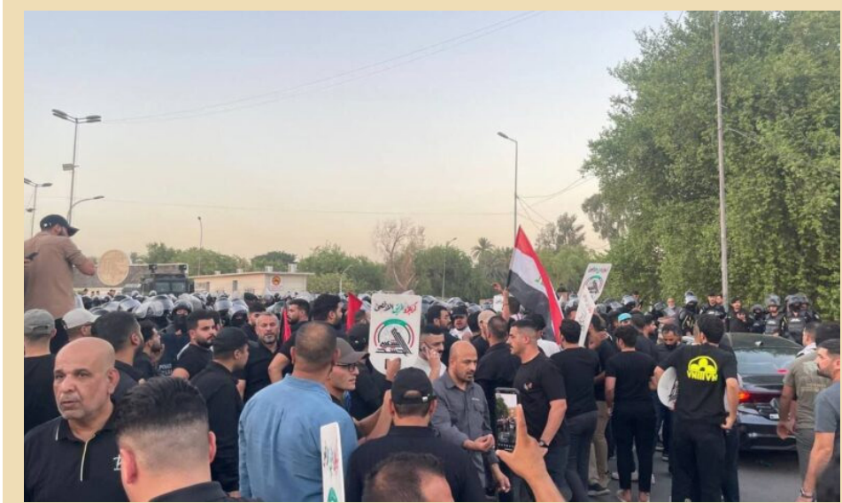
متظاهرون في بغداد ينددون بإغتيال السيد نصر الله

وأنتهت من خلال التجربة قدرتها على ذلك، ومضت «المقاومة» السلطانية، أن المسلحة ستقدم ما عليها في نصرة الشعبين اللبناني والعراقيين لا يخلون من مواقفهم الداعمة لفرضية الشعب اللبناني ومن قبل ذلك قضية غزة ورفض المسألة التي تسبب بها الكيان الصهيوني. ويحذر الباحث السياسي غالب الدعيمي، من حصول تغييرات في بعض دول المنطقة نتيجة الأحداث الأخيرة في كل من غزة ولبنان، وقال الدعيمي، في