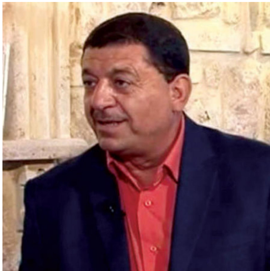
جانب من فعاليات المؤتمر

من إطار التراثية الى البنية الحديثة بدءاً من الستينيات. وشهدت العقود الجديدة وابتكارات الرواية لتصبح كتاب العرب المفضل أو ديوان العرب بدلا من الشعر. وأشار لدخول المرأة العربية مضمار الجنس الروائي. وهناك أصوات نسائية تنافس الرجل وتكتب بطريقة غير تقليدية ولا تقتصر صوت الرجل في محاولة الانطلاق وإعادة فهم العالم المعاصر.