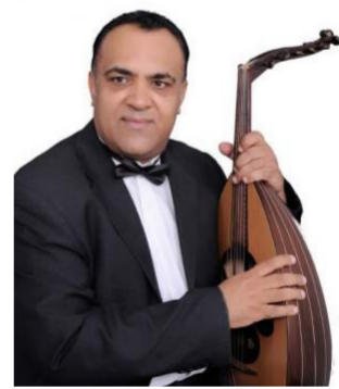
سامي نسيم سامي عازف عود عراقي. وهو مؤسس ورئيس "فرقة بغداد للعود" منذ 2013. ومدير

بغداد - الصباح الجديد: فجعت الأوساط الفنية والنشافية برحيل قامة فنية موسيقية هو الفنان سامي نسيم. ليُنحَق بركب من سبقه من الراحلين المؤثرين في الوسط الفني في العراق بالإضافة لاسهاماته الموسيقية الحاضرة في المناسبات والمهرجانات. ونعت نقابة الفنانين العراقيين رحيله بعبارة مؤثرة وموجعة. خت عنوان "فقد موجع". الجدير بالذكر أن الفنان الكبير