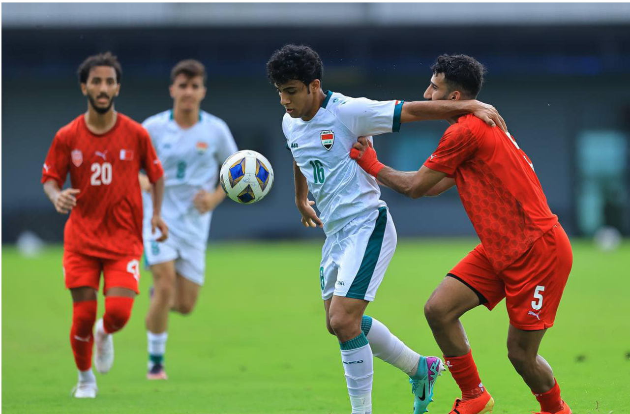
منتخبنا الشبابي في لقاء سابق