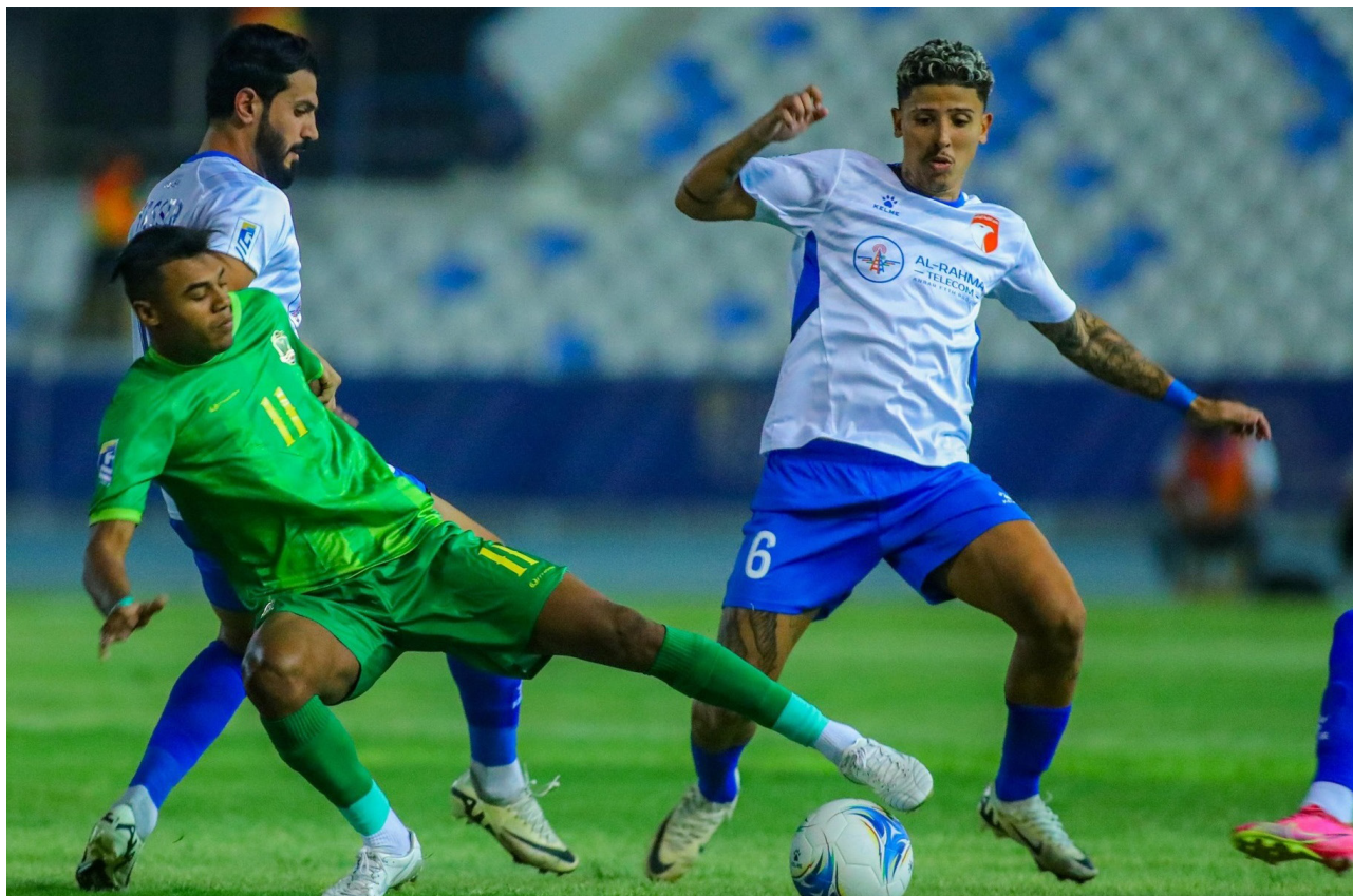
الشرطه يتعثر في انطلاقة دوري النجوم

لتحقيق تلك الرغبة. ومنحاهم الوقت من أجل إتمام الأمر. وهناك العديد من القنوات والمنصات أبدت رغبتها بشراء حقوق الدوري بشكل جزئي. وليس كليا كما تريد العراقية الرياضية.. منوها إلى أن ليست لدينا مشكلات مع الأندية. وكل الأمور المالية متفق عليها مسبقا.