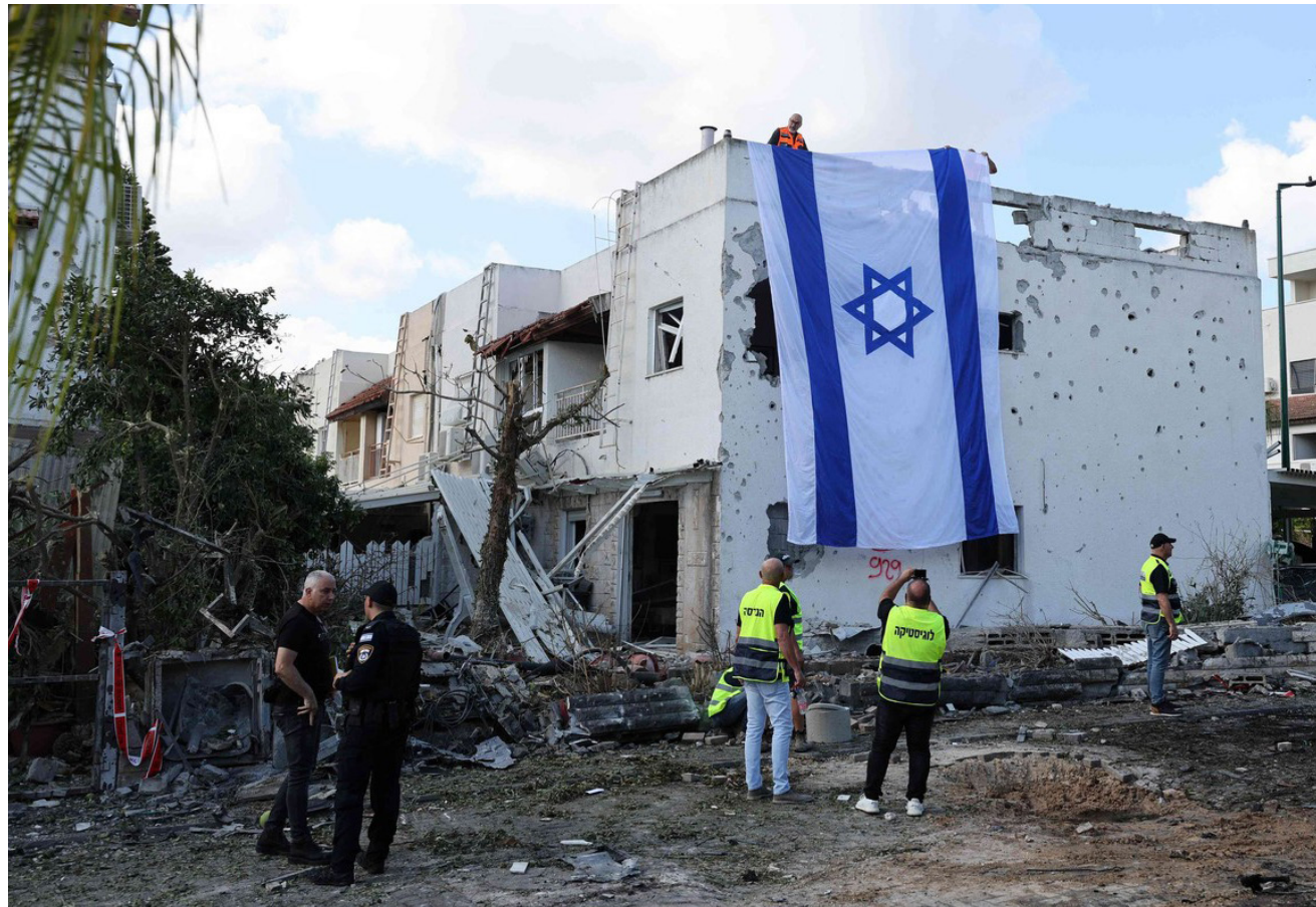
تضرر مبان في شمال إسرائيل بسبب رشقات صاروخية من حزب الله

أكتوبر الماضي. فيها 39 شخصاً وأصيب قرابة ثلاثة آلاف آخرين بجروح. جراء تفجير آلاف "أجهزة بيجرز". ثم أجهزة اتصال لاسلكي الأربعة استخدمها عناصر الحزب. وهذه المرة الأولى التي يعلن فيها حزب الله استخدام هذه الصواريخ المتوسطة المدى (مداهم يبلغ 100 كيلومترا) منذ بدء التصعيد في الثامن من