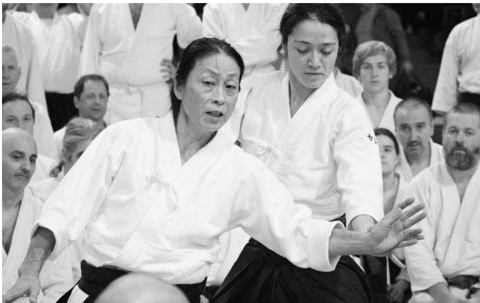
الايكيدو رياضة يابانية

* كلية اللغات/ قسم اللغة الإيطالية/ جامعة بغداد