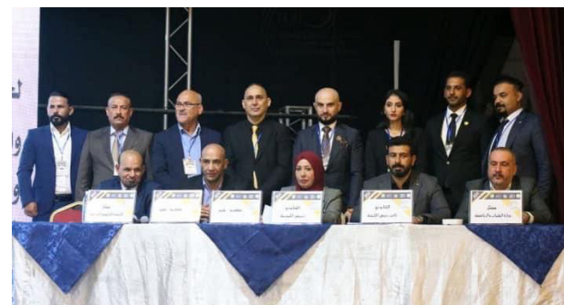
انتخابات تكميلية في اتحاد السيارات والدراجات النارية

عملاً جاداً وطفرة نوعية في رياضة المحركات في العراق وسط طموحات تذهب لجعل بلاد الراقدين بين الدول المتقدمة بالفعاليات كافة وتتطلب من الجميع التعاون الجديدة ستنضوي تحت لواء الاتحاد مهنتا الجميع بمناسبة الفوز. مشدداً أن المرحلة المقبلة ستشهد