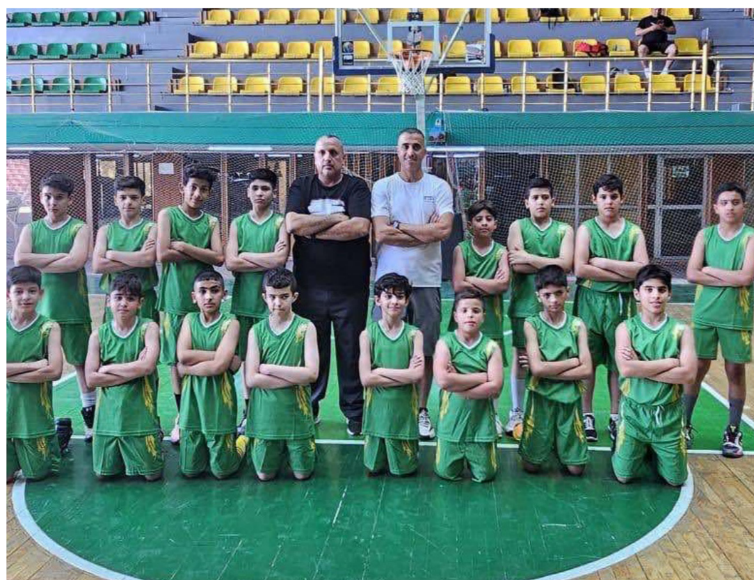
فريق الموهبة الرياضية المشارك في مهرجان المنى باسكت