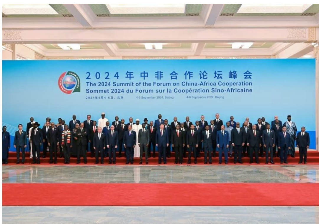
2024年中非合作论坛峰会 The 2024 Summit of the Forum on China-Africa Cooperation Sommet 2024 du Forum sur la Coopération Sino-Africaine 2024年9月4日，北京 4-6 September 2024, Beijing 4-6 September 2024, Beijing

وصاحب الندوة الافتراضية، عقدت جليستين نقاشيتين متخصصتين، جاءت الأولى بعنوان: "تحديات المحتوى العربي في وكالات أنباء دول منظمة التعاون الإسلامي الناطقة بغير العربية". والثانية بعنوان: "رؤية مجمع