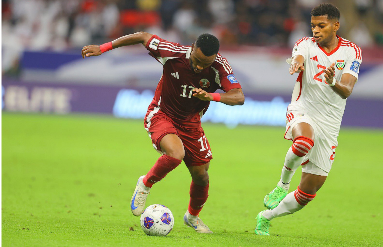
الإمارات تفوز على قطر

عقر داره. وهذه خطوة. وبما في خطوات. كنتم رجال. ونتمنى الاستمرارية. ومشوار الألف ميل يبدأ بخطوة». وتكبد المنتخب السعودي رقمًا سلبياً أعاد الأذهان لتذكرى اليمّة. بعد سقوطه في فخ التعادل الخيب أمام نظيره الإندونيسي. وتعادل الأخضر مع نظيره الإندونيسي 1-1 في الجولة الافتتاحية للدور الثالث من التصفيات الآسيوية المؤهلة لكأس العالم 2026. ويلعب الأخضر مع الصين خارج أرضه الثلاثاء المقبل في مهمة التعويض ضمن الجولة الثانية. ويعد هذا التعادل الخامس لمنتخب السعودية تحت قيادة الإيطالي روبرتو مانسيني. مقابل 4 هزائم. وانتصارات في جميع البطولات. سواء المباريات الرسمية أو الودية. ويأتي التعادل مع إندونيسيا بعد خسارة أمام الأردن في الجولة الختامية من الدور الثاني للتصفيات. وفشل المنتخب السعودي في الفوز في مباراتين متتاليتين لأول مرة منذ تعثره بالتعادل مع تايلاند. ثم كوريا الجنوبية في كأس الأمم الآسيوية التي أقيمت كانون الثاني الماضي بقطر. وقتها تعادل الأخضر مع تايلاند من دون أهداف في الجولة الثالثة من دور المجموعات. ثم تعادل 1-1 مع كوريا الجنوبية في ثمن النهائي. قبل أن يودع بركلات الترجيح. وتعد خسارة كأس آسيا هي الإخفاق الوحيد لمانسيني مع المنتخب السعودي حتى الآن. فغرم التعادل مع إندونيسيا إلا أن أماله حاضرة في التأهل إلى المونديال.