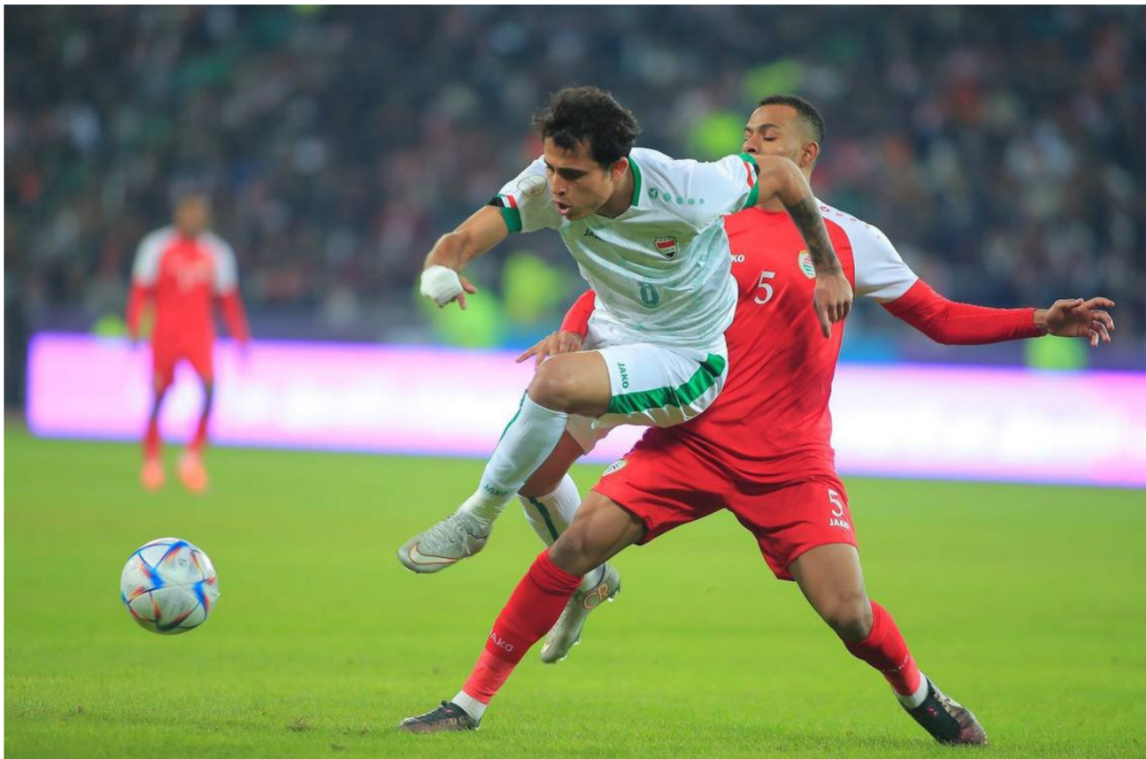
المنتخب الوطني في لقاء سابق امام سلطنة عمان

ومن جانب آخر أكد السفير من جانب العراق في الكويت بعد لقاء السفير مع النائب الأول لرئيس مجلس الوزراء ووزير الدفاع ووزير الداخلية الكويتي الشيخ فهد اليوسف، وكتب المنهل الصافي في تغريدة له عبر حسابه في موقع «إكس» أنه تم اعتماد آلية لدخول (5000) مشجع عراقي من يحملون جوازات السفر الإلكترونية، حضور مباراة تصفيات المجموعة الثانية المؤهلة لكأس العالم، والتي ستجمع المنتخبين الشقيقين على استاد جابر الدولي. ومن المقرر أيضا أن يقوم اتحاد الكرة في البلدين بتنظيم دخول المشجعين وإقامتهم بالتعاون مع الأجهزة الأمنية.