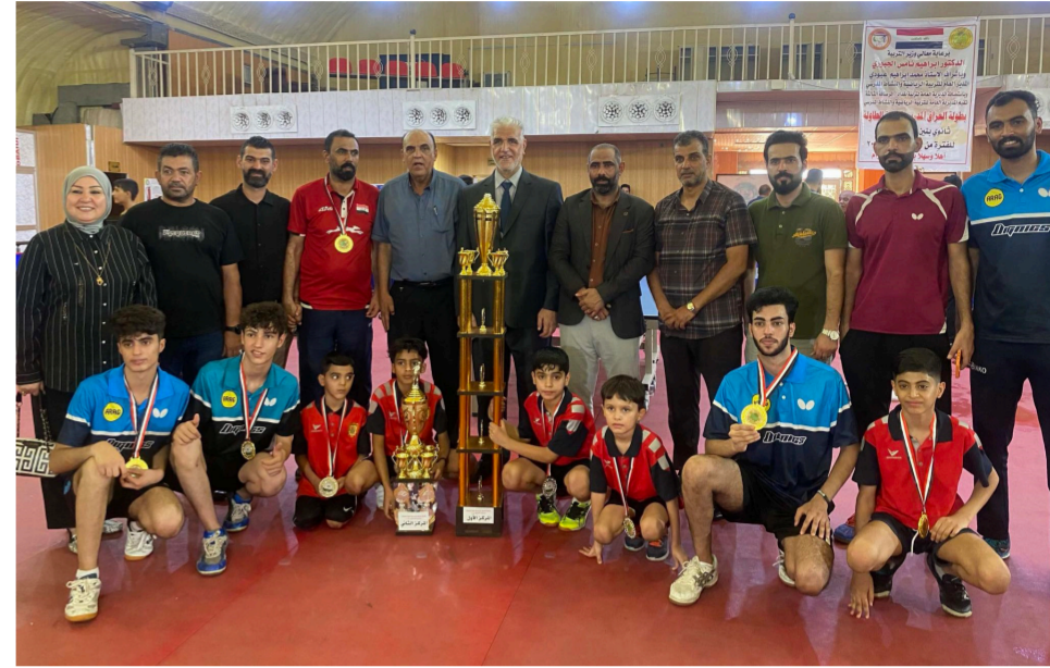
تربية ذي قار بطل الثانوي