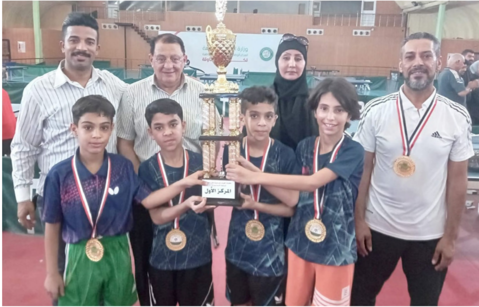
الرصافة الثالثة اولا في الابتدائي