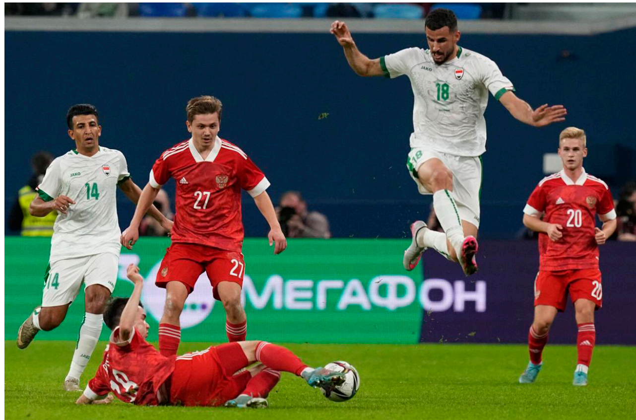
المنتخب الوطني في مباراة سابقة

للمنتخب الوطني من جانب اخر أجرى منتخبنا الشبابي تحت 29 عاما مباراته