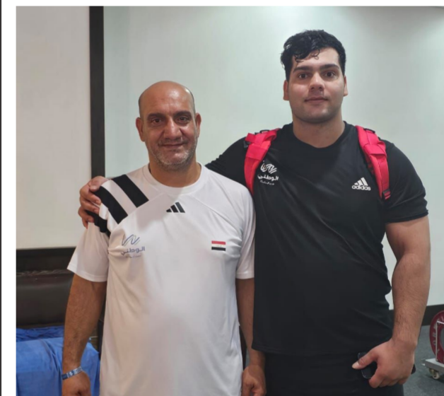
مشيداً بالدور الكبير والدعم اللامحدود التي تقدمه اللجنة الأولمبية لرباعنا الدولي من أجل المنافسة بشرف وقوة لتحقيق حلم الفوز بوسام أولمبي.