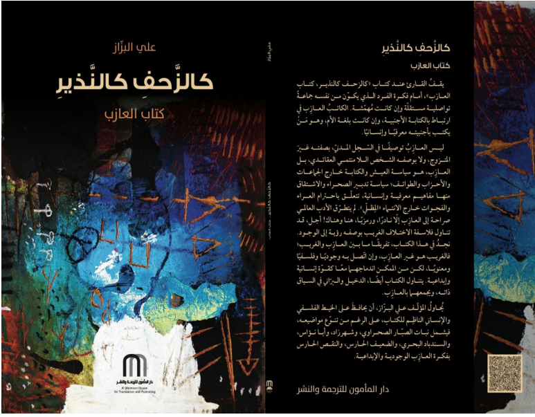
دار المأمون للترجمة والنشر

هو سياسية تدبير الصحراء واشتقاق مفاهيم معرفية إنسانية، تتعلق باحترام الفرجات خارج الانتصاف «الظلي»، لم يتطرق الأدب العالمي صراحة إلى العازب إلا نادراً ومرتباً هنا وهناك، حتى لو كان الفلاسفة قد تناولوا الاختلاف الغريب بوصفه رؤية إلى الوجود.