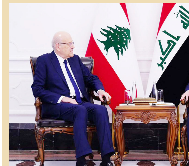
السوداني خلال استقباله ميقاتي يوم أمس في بغداد

عبد الغني ورئيسة الحكومة العراقية والسفارة العراقية في لبنان، لمعالجة أزمة مستحقات الفئول ولتجنب لبنان التهمة الشاملة. وكان فياض أعلن في وقت سابق أن شركة تسويق النفط العراقية «سومو» أوقفت توريد الفئول إلى المصدر إلى لبنان لعدم تسديد الأموال المستحقة للسنة الثانية على التوالي.