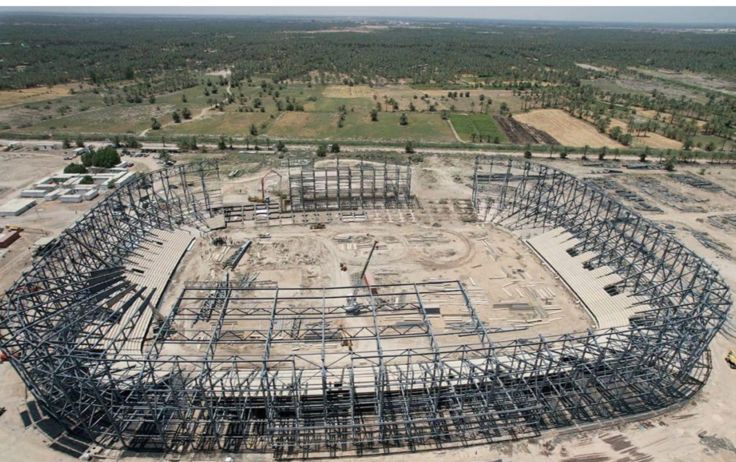
ملعب بابل .. تأكيدات على سرعة الإنجاز

خاص للسيارات. إلى جانب مساحات خضراء. كما تفقد وزير الشباب والرياضة الدكتور أحمد المبرقع. ملعب المسيب الرياضي سعة ٥٠٠٠ متفرج