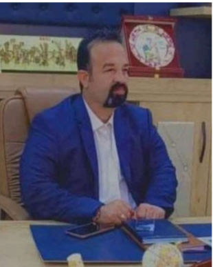
رئيس نادي الامواج

الجزء الثاني في حالات الخسارة والفشل في تحقيق الإنجاز. وهنا على المدرب المختار أن لا يدع المجال لانفعالاته السلبية هي المتحكمة لردات فعله وتصرفاته. إن كان أمام الجماهير مباشرة أو أمام أجهزة الإعلام. عليه أن يلتمس بضبط النفس والحكمة والبرود الضروري لئلا يفسد هذه اللواقف. كونه قوياً يحثي اللاعبين بها. بالإضافة لمتابعته من قبل الملايين من الجماهير عليه أن لا يلجأ للأعداء والشتماتع الجاهرة. وأن لا يرمي نعتات تلك الخسارة على أطراف أخرى. كأن يدعي أن اللاعبين لم ينفذوا الخطة التي وضعها. أو أن بعض اللاعبين لم يكونوا في الفورمة. أو أن الحكم كان قاسياً ولم يحسن ضرية جراء صحبحة أو احتسب ضرية جراء طائلة. أو أن بعض أن الأخطاء (الطقس) وأرضية الملعب أثرت على اللاعبين بحيث انخفض مستوى أدائهم جراء ذلك. أو أن جماهير الفريق الخصم تجاوزت على اللاعبين ما أثار ذلك سلباً على نفسيات لاعبيه وظهروا بذلك المظهر غير المتوازن. في النهاية، تبقى الجماهير هي العاصم الأول والأخير للفريق. ولكن يجب أن تبقى الأمور الفنية في يد الخبراء والمختصين لضمان تحقيق أفضل النتائج.