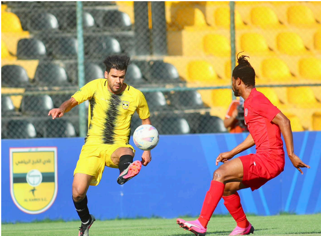
لقطة من دوري النجوم

بهدفين لهدف. في المباراة التي ضيفها لمرعب ميسان الدولي. ورغم التعادل فقد حافظ فريق النجم على مركزه الخامس برصيد 64 نقطة. فيما رفع نطق ميسان رصيده إلى 46 نقطة ارتقى فيها إلى المركز العاشر. وتمكن فريق نوروز من خطف نقطة ثمانية من مضيفه فريق الكهرماء بعد أن فرض التعادل الإيجابي بهدف لملته. ورفع نوروز رصيده إلى 55 نقطة في المركز السابع. وكذلك الحال بالنسبة لفريق الكهرماء الذي رفع رصيده إلى 41 نقطة في المركز 13. ولم يتمكن فريق الطلبة من اجتياز فريق الميناء. حيث انتهت المباراة بالتعادل السلبي بدون اهداف. وأضاف من خلالها كلاهما نقطة إلى رصيدهما. ورفع الطلبة رصيده إلى 51 نقطة في المركز الثامن. فيما رفع الميناء رصيده إلى 42 نقطة حافظ فيها على مركزه 12. وتمكن فريق أربيل من تحقيق فوزا كبيرا على فريق كربلاء بأربعة اهداف لهدف. وبهذا الفوز أضاف فريق أربيل 3 نقاط مهمة إلى رصيده الذي وصل إلى 40 نقطة