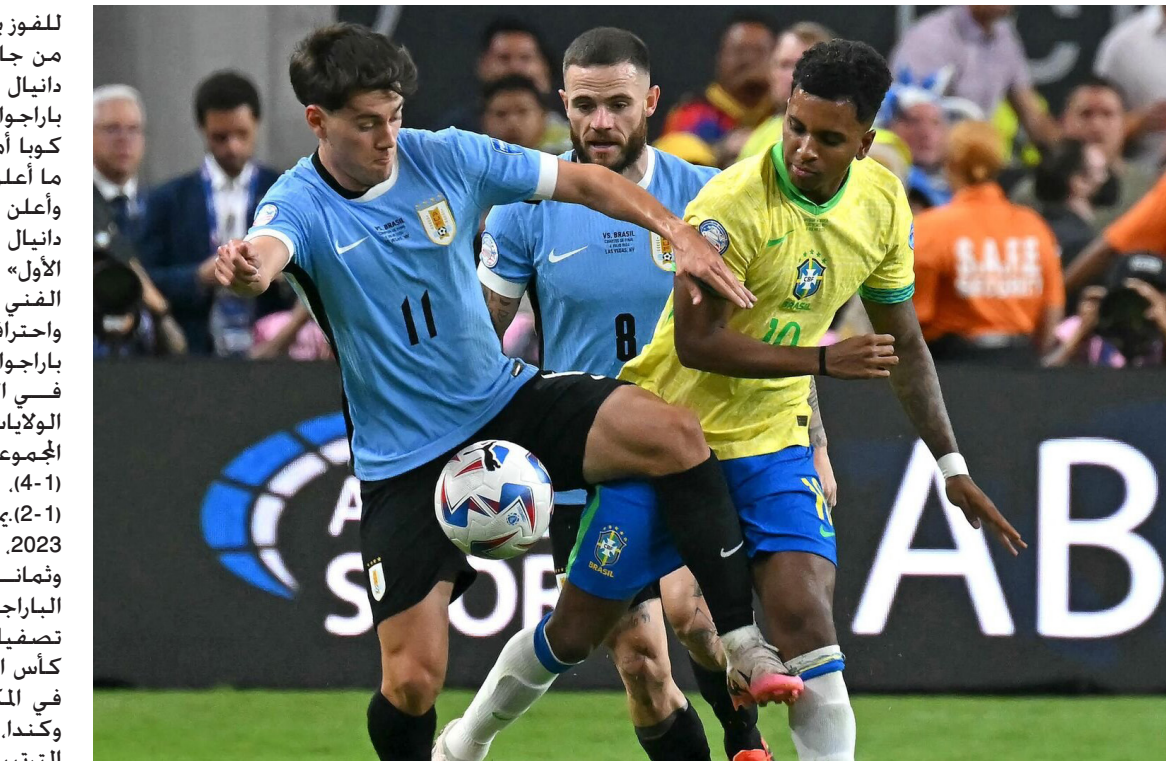
البرازيل تودع كوبا أميركا

للفوز بلقب الدوري بعد 35 عامًا. من جانب آخر أقيمت الأجنطيني دانيال جارنيرو من تدريب منتخب باراجواي. بعد النتائج السلبية في كوبا أميركا لكرة القدم. وفق ما أعلن الاتحاد المحلي للعبة في بيان. وأعلن الاتحاد «نهاية العلاقة مع دانيال جارنيرو كمدير لمنتخب الأول». وشكره بعد كامل جهته الفني على التزامهم وتفانيهم واحترافيتهم». وخرج منتخب باراجواي بحصيلة مخيبة للأمل في البطولة المقامة حاليا في الولايات المتحدة. بعد إقصائه من دور المجموعات إثر خسارته أمام البرازيل (1-2). وكوبستاركا (1-2). بملك جارنيرو الذي عين عام 2023. في سجله فوزين وتعادلين وثماني خسارات. ويحتل المنتخب الباراجوياني المركز السابع في تصفيات أمريكا الجنوبية المؤهلة إلى كأس العالم 2026. المقرر إقامتها في المكسيك. الولايات المتحدة وكندا. علما أن الستة الأوائل في الترتيب من أصل 10 تبلغ نهائياتها البطولة مباشرة.