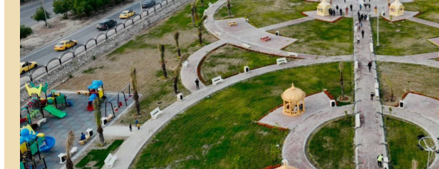
الغابة الصناعية ستخفف من حدة التلوث في بغداد

بغداد - الصباح الجديد: وقال أمين بغداد، عمار موسى كاظم، أعلن الخميس (6 حزيران 2024)، عن قرب اطلاق العمل بمشروع تحويل أرض معسكر الرشيد جنوبي العاصمة إلى غابات ومناطق ترفيهية مستدامة تعد «الأكبر من نوعها في العراق بمساحة (5) آلاف دومت».