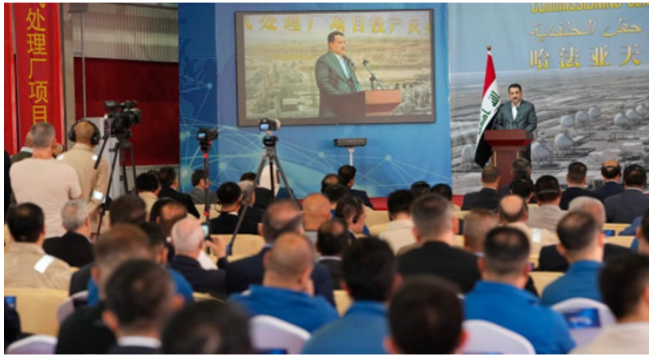
السوداني خلال افتتاحه مشروع حفل الخفافية بمحافظة ميسان

*رئيس الوزراء: سنغادر حرق الغاز المصاحب بحلول 2028