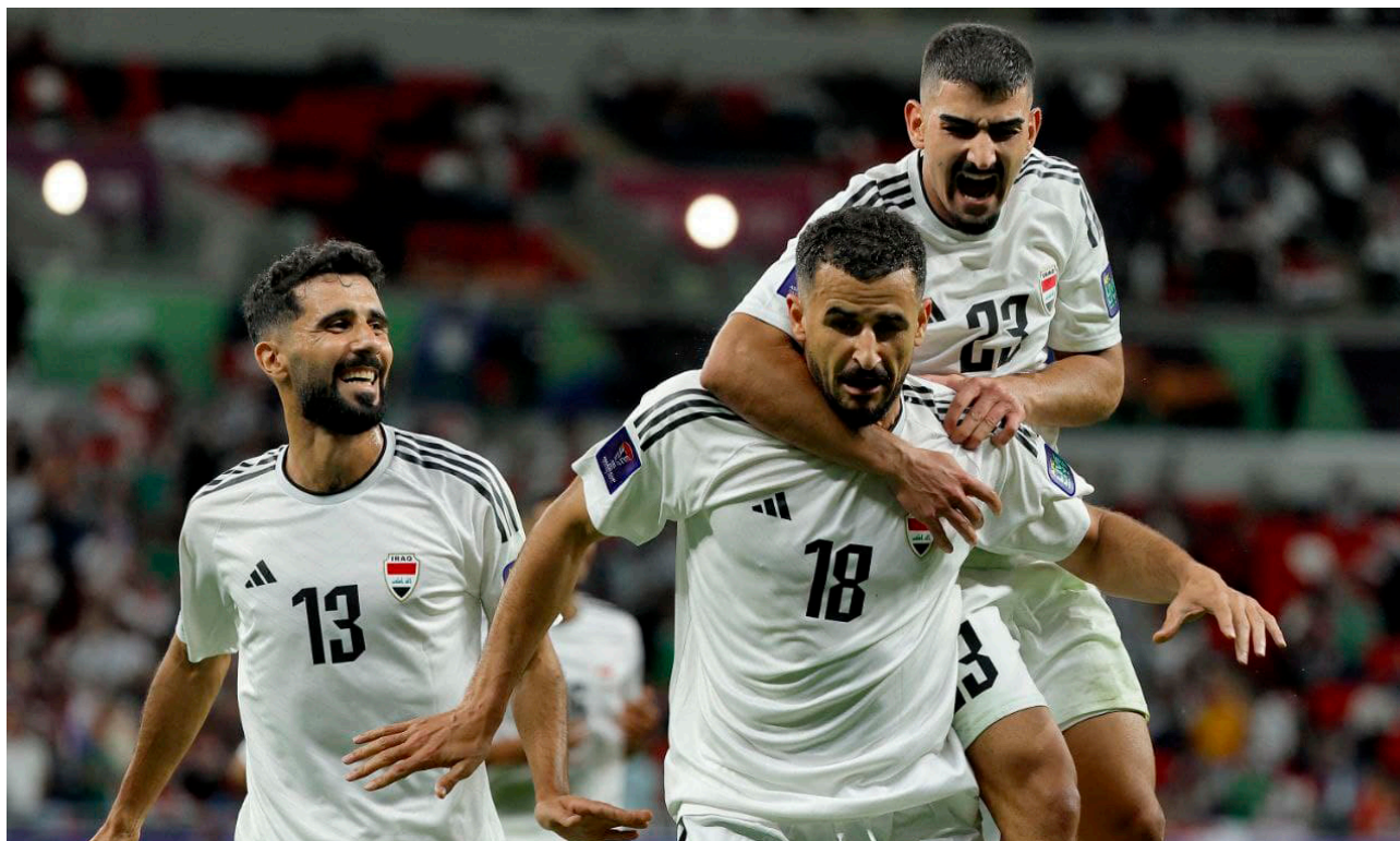
العراق يسعى للفوز على إندونيسيا

وان تُسَخَّر كل الجهود من أجل مشاركة مشرفة. فالجميع يتطلع لمشاهدة منتخبنا بصورة تليق بسمعة وتاريخ الكرة العراقية. مشيراً إلى أهمية اللقاءات المتكررة بين اتحاد الكرة واللجنة الأولمبية من أجل تهيئة كل مستلزمات النجاح. وشدد مفتن على ضرورة التركيز على الجوانب الإدارية وتسهيل إجراءات المشاركة العراقية في أولمبياد باريس من خلال تسخير جميع الجهود. واستنفاً كل ملاكات اللجنة الأولمبية لتقديم الدعم اللازم على الصعيد اللوجستي والفني والإداري. يذكر أن منتخبنا الأولمبي سيخوض المنافسات الأولمبية ضمن المجموعة الثانية إلى جانب منتخبات الأرجنتين والمغرب وأوكرانيا. وسيفتتح منتخبنا مشواره بمواجهة المنتخب الأوكرائي في الرابع والعشرين من تموز المقبل.