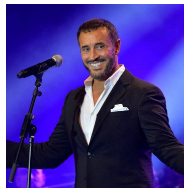
لا تسألني لا ترحلوا". ليجلس الساهر عودته لطرح اليوم غنائي جديد بعد 8 سنوات من طرح آخر ألبوماته "كتاب الحب" عام 2016. كما طرح كاظم الساهر مؤخرا أغنية "Hold your fire".

متابعة - الصباح الجديد: يحيى النجم كاظم الساهر حفلاً غنائياً 15 نوفمبر / تشرين الثاني المقبل في مسرح مدينة العرقان في عمان. ومن المقرر أن يقدم جمهوره باقة متنوعة من أغانيه القديمة والحديثة التي يتفاعل معها الجمهور. كما يحيى النجم كاظم الساهر حفلا غنائياً في مصر يوم 28 حزيران المقبل. وذلك في منطقة هرم سفارة بالبدرشين. بعد أكثر من عامين على آخر حفل غنائي له في مصر. والذي كان داخل دار الأوبرا المصرية. وطرح كاظم الساهر مؤخرا ألبوم "مع الحب" يتضمن 13 أغنية جميعها من ألحان وغناء كاظم الساهر. والأغاني هي: "يا وقيّة. يا قلب. بيانو. معك. تاريخ ميلادي. رقصة عمر لا نظلّمه. تراني أحبك. أعود. الليل. مرت بصدري.