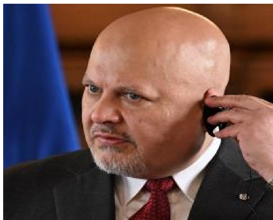
كرم خان المدعي العام بالجناينة الدولية

إلى استراليا. القارة العقابية حينها. في حزيران/يونيو 2020، أصدر قراراً يفرض عقوبات على المحكمة الجنائية الدولية، وعلى فتوة بنسودة المدعية العامة للمحكمة حينها. استبقا لفتح تحقيق في جرائم حرب ارتكبها جنود أميركيين في أفغانستان. وفي ذلك السياق، وصف مايك بومبيو، وزير الخارجية في إدارة ترامب، المحكمة بأنها «محكمة كانغرو». والحوال أن موقف الولايات المتحدة من المحكمة الجنائية الدولية ظل متقلباً حسب الظروف. وانتقائياً، فمن ناحية، رحبت واشنطن بحماسة بالغة. بقرارات المحكمة في ما يخص الإبادة العرقية في دارفور. ولاحقاً بمذكرة التوقيف الصادرة بحق الرئيس الروسي فلاديمير بوتين على خلفية الحرب في أوكرانيا. لكنها في الوقت ذاته، عارضت بشدة ويشكل مواصلة. إمكانية تمثيل مواطنيها أمام قضاة. وفي سبيل ذلك اتخذت سلسلة طويلة من الإجراءات على مستوى دولي. كان من بينها إجبار حكومات الدول الأخرى على توقيع بنود تمنع تسليم المواطنين الأميركيين