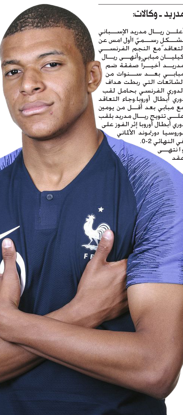
مدير - وكالات:

مبابي (25 عامًا) مع بطل الدوري الفرنسي باريس سان جيرمان هذا الصيف بعد أن حقق معه جميع الألقاب المحلية الممكنة منذ انضمامه إليه في 2017. وذكر العديد من التقارير الصحفية أنّ مبابي الذي سيجتهد عقده خمسة مواسم سيحصل على مكافأة تواقع تصل إلى 100 مليون يورو بـ15 مليون يورو منذ سنوات المراهقة. بدأ أن مستقبل الموهوب كيليان مبابي سيكون لامعًا. يجد ابن الخامسة والعشرين نفسه ضمن أبرز صفقات كرة القدم التاريخية. مع انتقاله من باريس سان جيرمان الفرنسي إلى ريال مدريد الإسباني بطل أوروبا. زاول «كيكي» اللعبة في مسقط رأسه بضاحية باريسية حتى سن الرابعة عشرة. وتوّج وقته بين مقررات التدريب ومد رسة في قرية. بدأ ببلفت الأنبيه الأندية الأوروبية الكبرى. إلا أن موناكو المعروف بضمّه للمواهب الشابة. تمكن من إقناع عائلته في العام