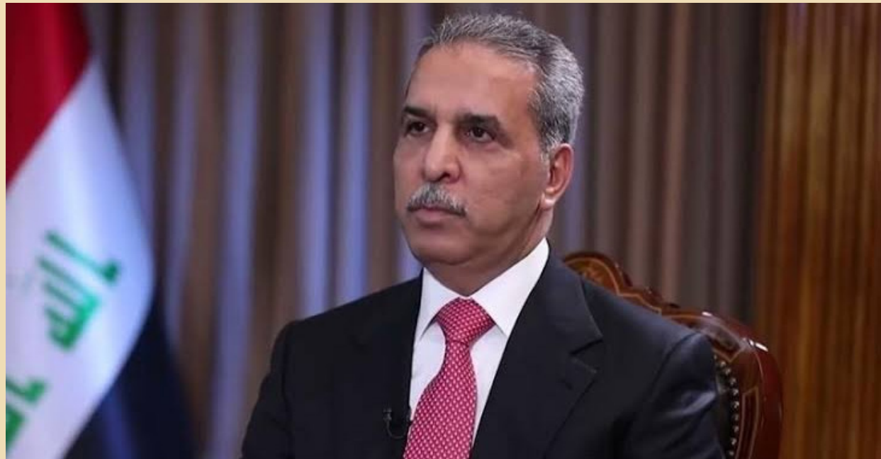
رئيس مجلس القضاء الأعلى فائق زيدان

سبق للمحكمة الاتحادية أن اتخذت قرارات عُدّت باطللة لكنها كونها ملزمة فليس بوسع أحد الاعتراض عليها. وبعد أبرز قرارات اتخذهما المحكمة الاتحادية العليا وأثارها ضجة كبيرة هما قرارها القاضي بمنع وزير الخارجية