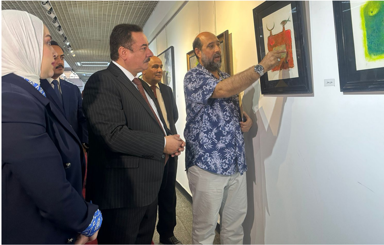
بغداد - وداد ابراهيم:

ووجد عدد من الفنانين المشاركين أن المعارض التي تحمل قضية إنسانية. فدانها ما يكون لها تأثير كبير على المتلقي. ذلك أن الأعمال التي عبرت عن تشقق الأرض ووقوف الزوارق على أرض يابسة في الأهورا. لفة تحمل الكثير من الألم الذي تعرض له الانسان الذي عاش في الأهورا منذ آلاف السنين. وهو ينعم بخيراتها من الطيور والأسماك والطبيعة. حتى جاءت التغييرات لتجلب الطبيعة الجميلة الى أرض جرداء.