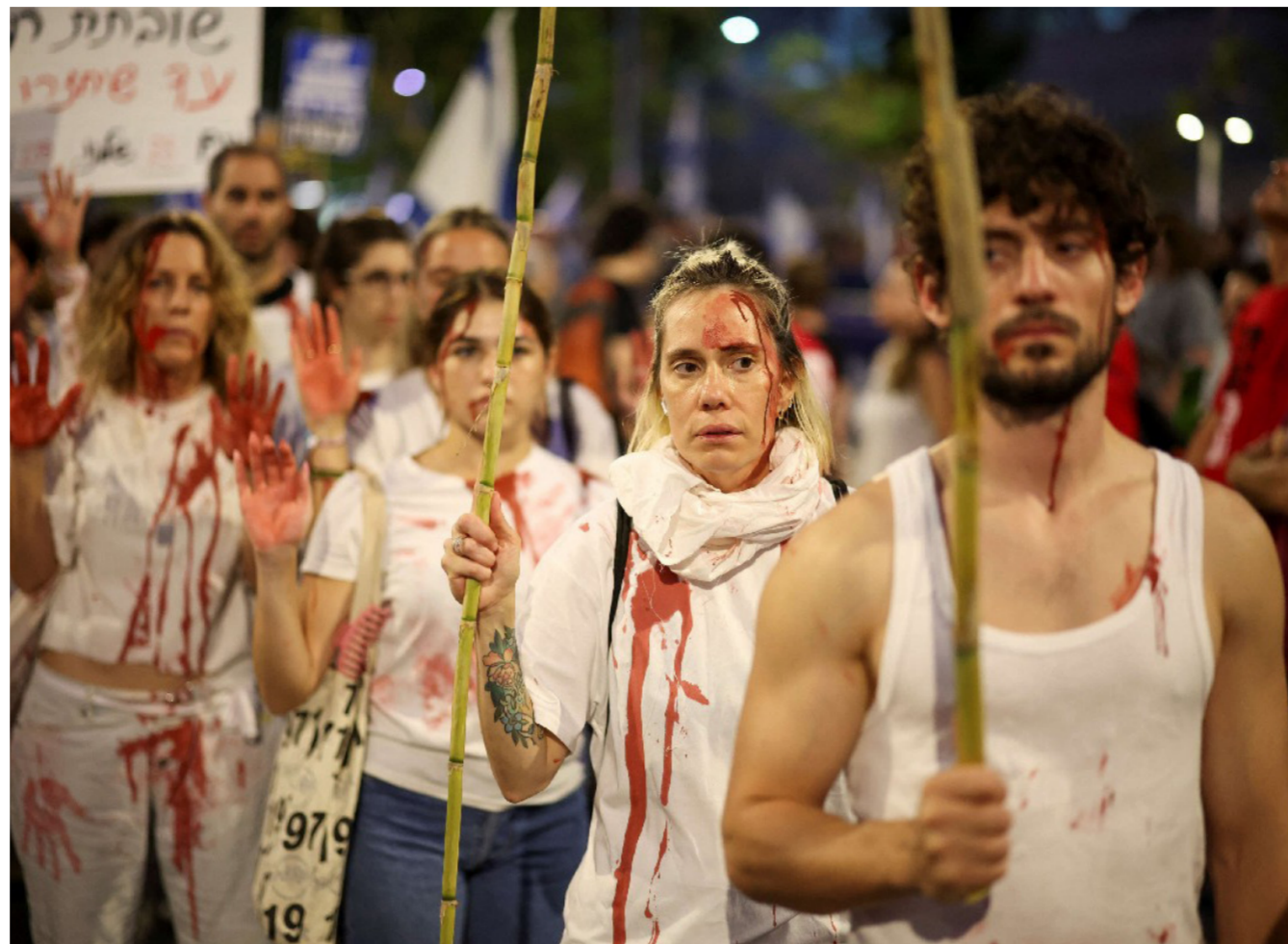
متظاهرون يحملون لافتة كبيرة كتب عليها "بايدن، أنقذهم من نتانياهو".