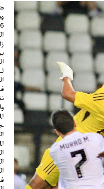
لقطة من دوري نجوم العراق