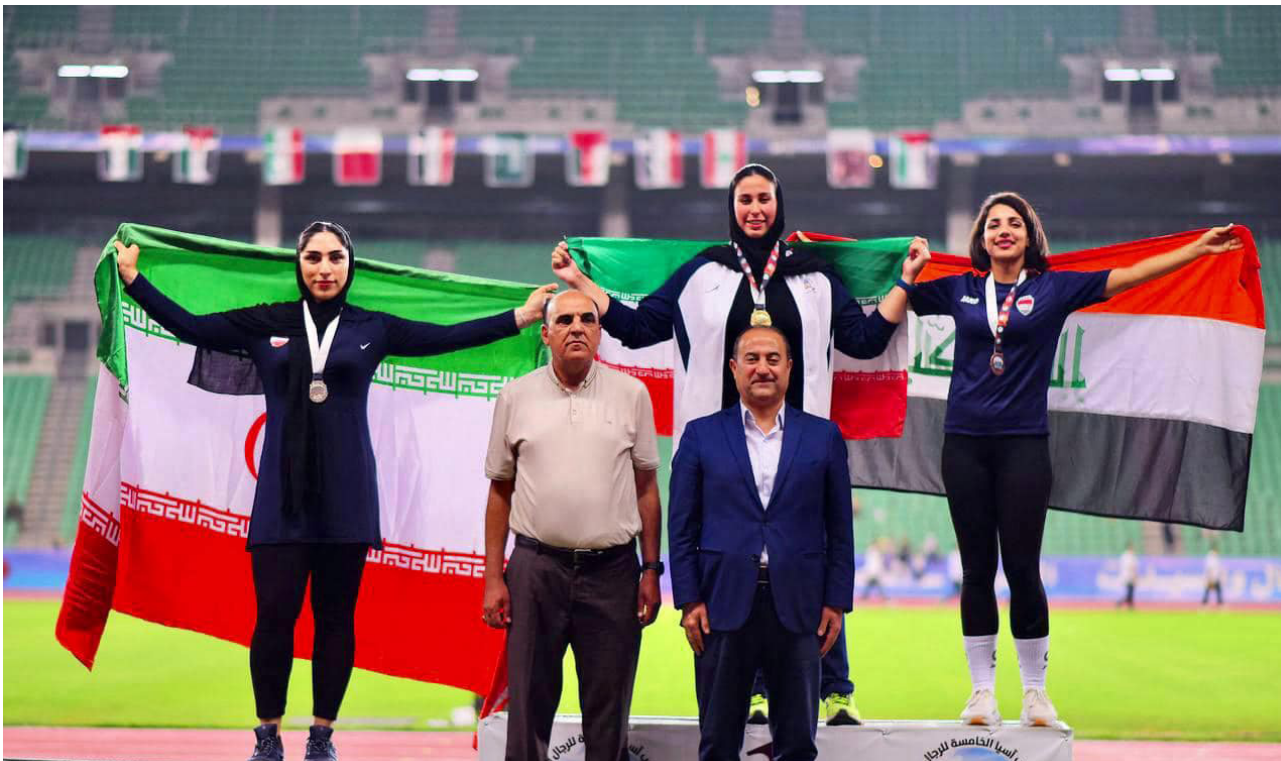
تتويج الفائزين بأوسمة غربي آسيا بألعاب القوى

من قبل دولة رئيس الوزراء السيد محمد شياع السوداني لهذه البطولة، فضلاً عن دعم ومتابعة رئيس اللجنة الرياضية في محافظة البصرة، هو المستوى الفني المتناسق والتقارب لجميع المنتخبات المشاركة، وهذا ما يعطي للبطولة طابعاً