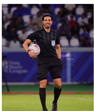
دولة قطر الشقيقة بإشراف محاضري الفيفا VAR، وبمشاركة محاضري VAR في آسيا وأفريقيا وأوقيانوسيا.

بغداد - الصباح الجديد: يفرض طاقم تحكيم دولتي عراقي مواجهة قيمة الدوري التونسي للرجال في المباراة الأولى الفاصلة ضمن المجموعة الأولى بين فريقين الترجي والإفريقي اليوم الأحد، وتسمية طاقم التحكيم هذه جاءت وفقاً لذكرات التعاون بين الاتحاد العراقي لكرة القدم وبين الاتحاد التونسي لكرة القدم والاتحادات الصديقة لغرض تبادل الطواقم التحكيمية، وسيتألف الطاقم الدولي العراقي من