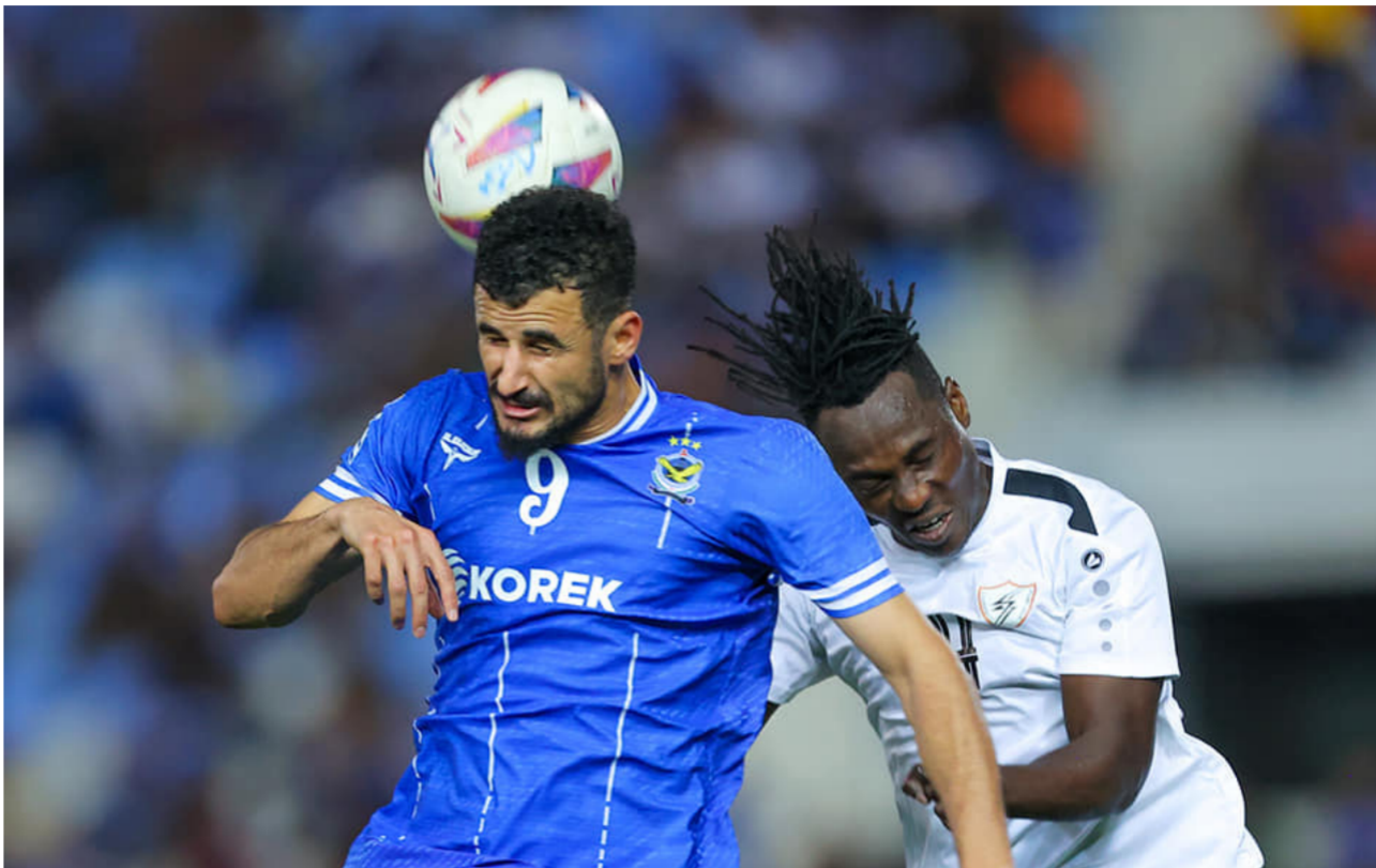
الجوية يلاقي الزوراء اليوم في الكلاسيكو