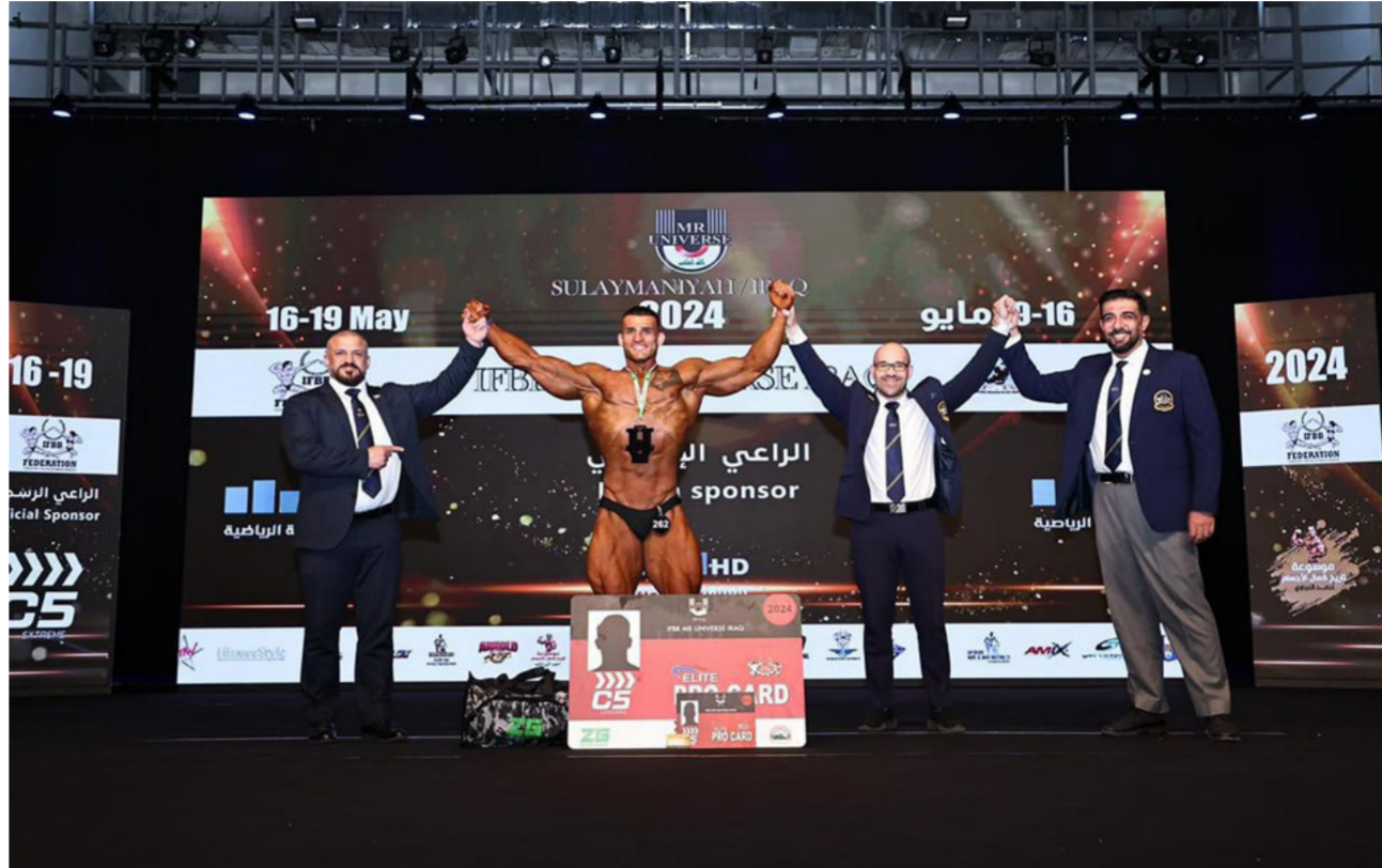
جانب من منافسات بطولة بناء الاجسام في السليمانية