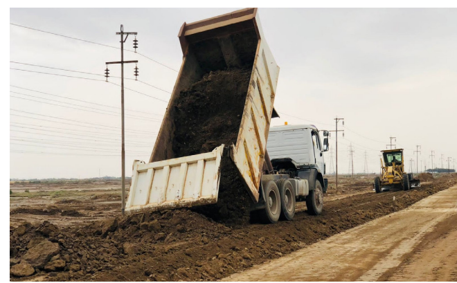
الامنية والمباشرة بأعمال القناطر الانبوبية مع النهولت. يذكر ان نسبة الإنجاز للمشروع قد بلغت نسبة 30 %