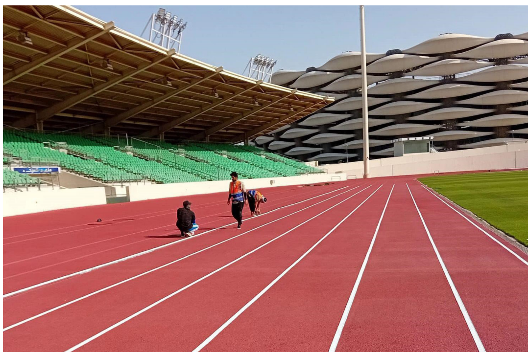
ملعب المدينة الرياضية يستعد لغربي آسيا بالقوى

المدرّب أيضا إلى الاستمارة المدة من قبل وزارة الشباب والرياضة لتقييم أداء مديري مديريات الشباب والرياضة في بغداد والمحافظات. تنفيذا لقرار مجلس الوزراء رقم (23465) لسنة 2023 الفقرة الخامسة، المنضمين تولى وزارة الشباب والرياضة إجراء تقويم نصف سنوي لاداء مديري مديريات الشباب والرياضة، ورفع التوصيات إلى المجلس الأعلى للشباب لآخذ القرارات والتوصيات اللازمة بشأنها. وبين مدير مركز التدريب، ورفع التوصيات إلى إمامة هذه الدورة هو تعريف المشاركين بمهامهم إدارة الجودة ومبادئها وأهميتها، وكذلك التعرف على معايير نموذج التميز الأوروبي «EFQM»، والمساعدة على تحديد مكان المؤسسة في رحلتها تجاه تحقيق التميز، وتوفير لغة عامة مشتركة لتمكين تبادل الأفكار والمعلومات داخل وخارج الدائرة، وتضمين الأنشطة الحالية والمخطط لها بما يؤدي إلى تحسين كفاءة وفعالية أداء العاملين، وبرعاية وزير الشباب والرياضة الدكتور أحمد البرقع، نظمت دائرة الرعاية العلمية رحلة للطلبة المتميزين، إلى محافظة السلبيمانية وأقامت مخيما بمشاركة 100 طالب والملاك الإداري لوزارة التربية، ويستمر لمدة خمسة أيام لنشر الوعي بأسياسات كتابة السيرة الشخصية للطلبة، وقال مدير عام دائرة الرعاية العلمية