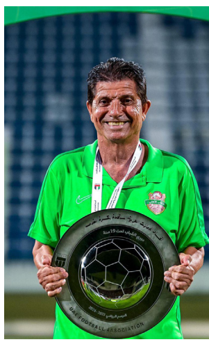
يتكلمون من خلال المستوي الفني الذين يقدمونه خلال مباريات الدوري.