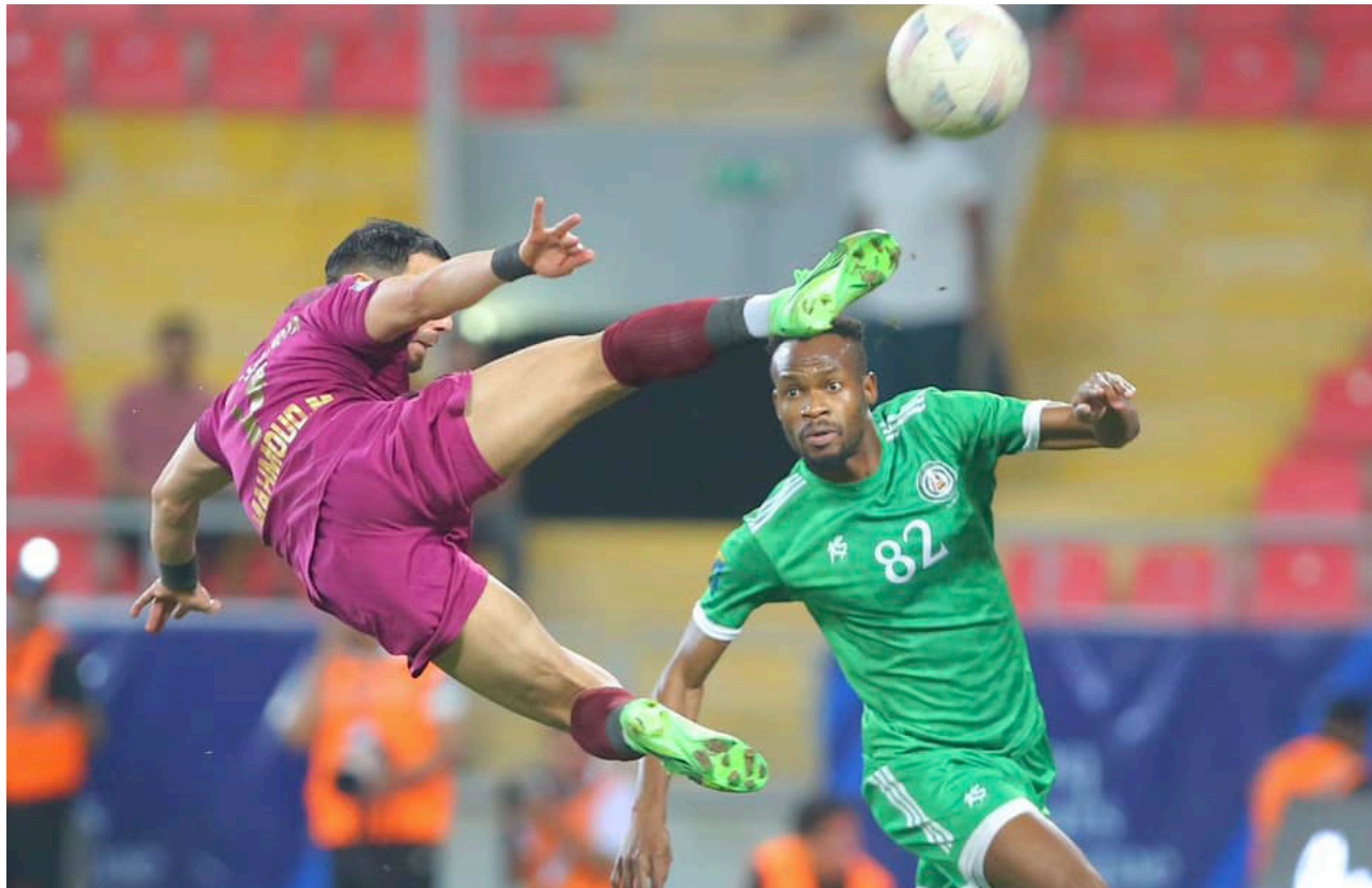
الشريطة يستعيد صدارة الدوري بالفوز على كربلاء

استعاد فريق الشريطة صدارة دوري نجوم العراق بانتهاء جولته التاسعة والعشرين بعد ان حقق فوزاً مهماً على فريق كربلاء بهدفين لهدف. في المباراة التي جرت على ملعب كربلاء وبهذا الفوز رفع الشريطة رصيده الى النقطه 64 في صدارة الترتيب. فيما جمد رصيد فريق كربلاء عند النقطه 29 في المركز 14. ولم يتمكن فريق القوة الجوية الضرب بنقاط المباراة التي جمعته بفريق الميناء. وخرج بتعادل سلبي من دون اهداف. ورفع القوة الجوية رصيده الى 63 نقطة في مركز الوصافة. مع امتلاكه مباراة مؤجلة واحدة. فيما وصل رصيد فريق الميناء الى 33 نقطة في المركز 12. والحال ينطبق نفسه على فريق الزوراء الذي لم يتمكن من تحقيق الفوز على ضيفه فريق زاخو. وخرج بتعادل إيجابي بهدفين لهدف. في قمة مباريات الدوري والتي جرت على ملعب ورفع الزوراء رصيده الى 56 نقطة حافظ فيها على مركزه الثالث. وكذلك الحال لفريق زاخو الذي رصيده الى 49 نقطة حافظ فيها على مركزه الرابع. وعزز فريق النجف موقعه الخامس بفوز صعب حققه على فريق ذوق بهدف وحيد. في المباراة التي جرت على ملعب النجف الأولي وبهذا الفوز رفع النجف رصيده الى 49 نقطة حافظ فيها على المركز الخامس. فيما جمد رصيد فريق ذوق عند النقطه 44 في المركز