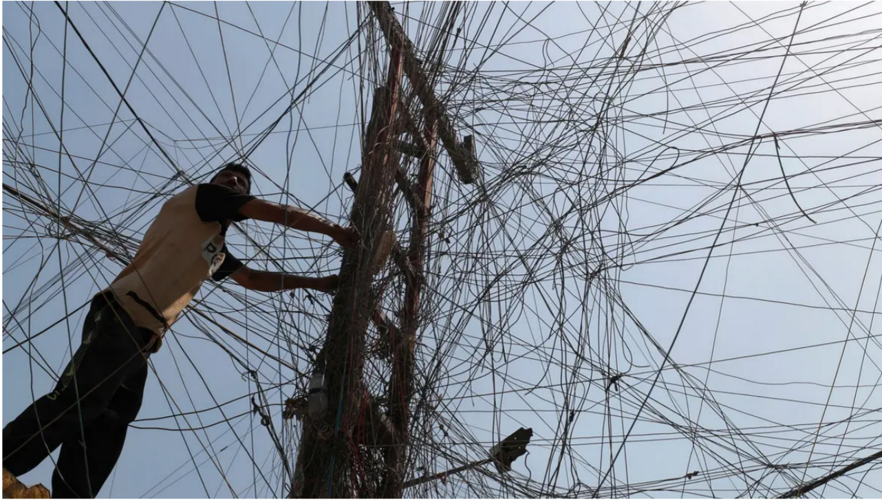
بغداد - وداد إبراهيم:

بغداد- وداد إبراهيم: الصيف.. الفصل الذي يختلف بين دولة أخرى حسب التنوع المناخي، فما أن يدخل حتى تبدأ عروض السفر من أجل الهروب من حرارته، ومشاكله، ومضاعب توفير التيار الكهربائي واستمراره، ورغم أن الصيف ألف حكاية وحكاية مع الاستعداد له، فإن الكثير من العوائل العراقية تستقبل هذا الفصل الذي يعد الأطول بين الفصول الأربعة بتغيير البيت كله من السجاد الذي يغسل وينظف ومن ثم يلف ويحفظ في مكان خاص في البيت، وتبدأ حملة كبيرة في البيوتات البغدادية بغسل كل المفارش والأغطية القطنية والصوفية في أماكن غسل السجاد والمفارش من شركات، إضافة إلى عملية حفظ الملابس الشتوية.