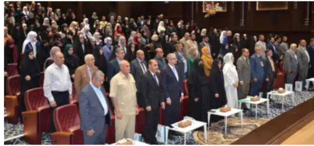
مشاركة دار الكتب والوثائق في المهرجان السنوي الثالث للكتاب

تتصدى له الدار بصفتها المشرف العام على جميع المكتبات في العراق. ومساعيها الجادة في التكامل مع أهداف المؤسسات الأكاديمية على النحو الذي يعزز نمو الواقع الثقافي والفكري في البلاد. المهرجان الذي جاء برعاية الأمانة العامة للعتبة الحسينية المقدسة. ضم عدداً من الحوار