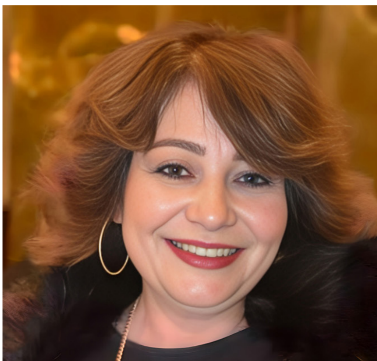
الكاتبة أميرة النبراوي

كما اتهمني ... ذنبي الوحيد أريد أن املكه. وفي حزنه استنشقه كالحياة. ليته يعرفني يفهمني يقرأني كقصيدة عشيق. زاده جبي فسوة وغرورا. كنت طيرا مُحلقا في سماء الحب. أبدو جميلة مضينة) ... حتى صيغة التمني في هذا النص كانت عذريته واضحة للقارئ وللعيان. فهي لسم تطلب منه رغباتها الانثوية الجامحة. بل أكتفت بشيء من التمني الخالم. التمني بالرغبة الحسية لا الرغبات الجنسية ولم تظهر له صورتها ومشاعرها الانثوية الصارخة وجمالها الفيضانية. رغم أنها أجمل من كل عشيقاته الليليات كما أشارت في نصها : (اراد مني أدفن كل جمالي وعالي ومعالي حتى هويتي وقيمتي. لكوني أجمل من خيلاته) ... في هذا النص عللت رغبتها وجمعت خيول مشاعرها بلاوعي طالبة ما يكمن في بيرها لتوصيف شيء في نفسها كأي أنثى ترغب من عشيقها أن يشاركتها بمشاعرها الجميلة. لكنها أكتفت بالتحليل فقط. كان طلبها أيضاً عذري. لأنها تخاطبه أو تطلب منه من خلال الاستبشار بالرغبة. بعيدة كل البعد عن الطلب الشخصي أو التماس الحسي أو الجنسي. فتقول : أشعر بحرارة أنفاسهم في صدري. يتلمس شففتي بإبهامه. أحاول أن امتص إبهامه. يُد كفه على رقبتي من الجهة اليسرى تحت الأذن. أشعر برعشه. أذوب بأحضانه. أبحث عنه عطشياً. وأنا في صدره كمولود رضيع يبحث عن صدر أمه ليرتوي من فرات حليبها. نبضات قلبي