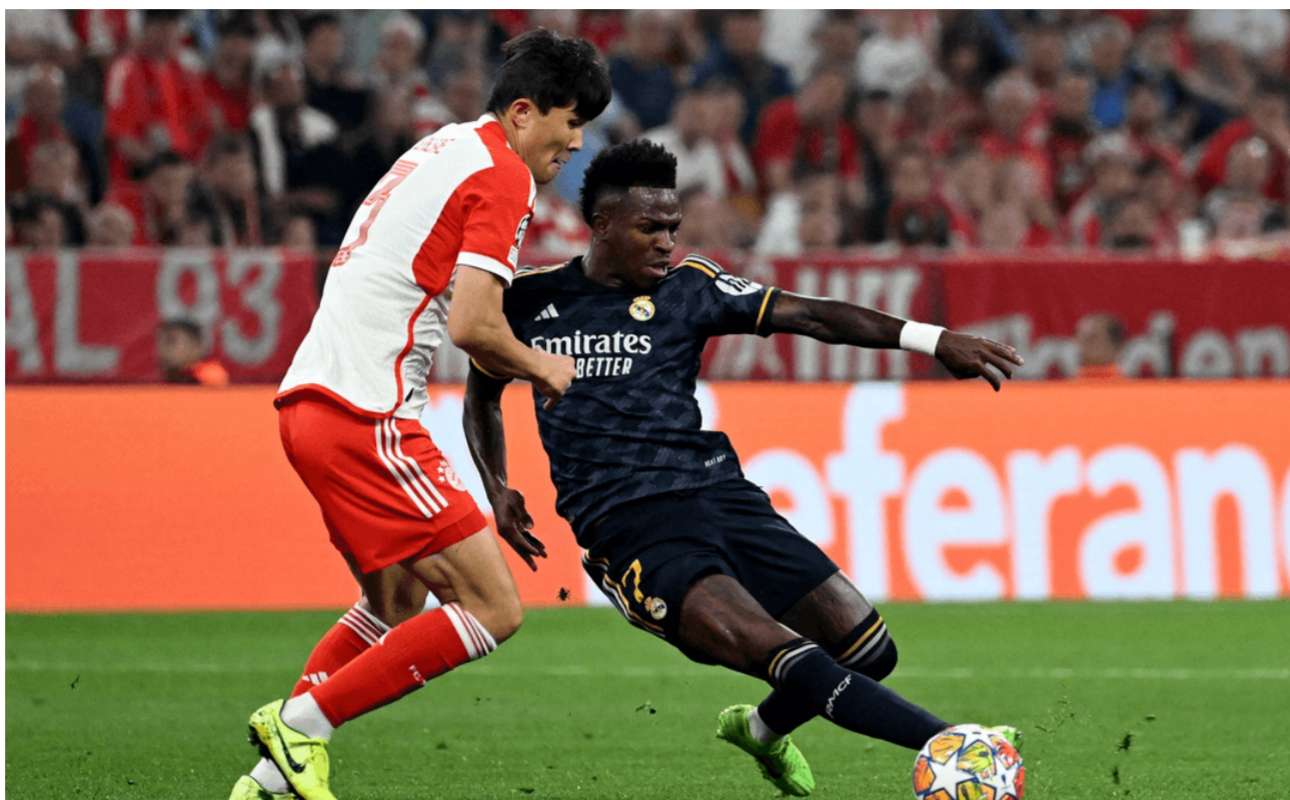
ريال مدريد يتعادل امام بايرن ميونخ

يجب التغيير لأن لدي خيارات مميزة على دكة البدلاء، وأتم: «أنا هنا للقتال. ولم يتبق سوى 90 دقيقة من أجل الوصول للنهائي في لندن».