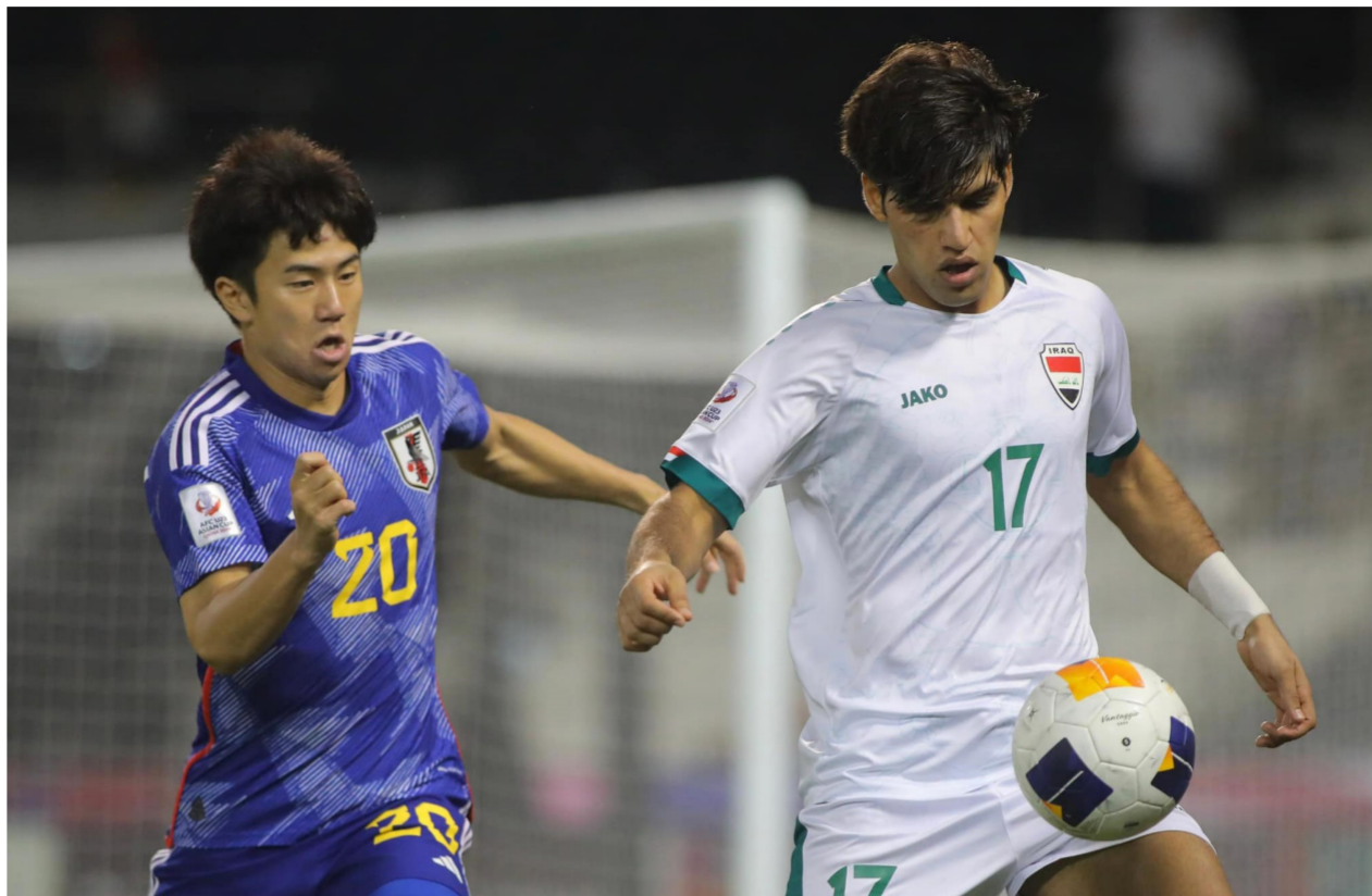
جانب من لقاء الأولمبي امام اليابان

ملعب خويبا الرياضي لتحديد صاحب المركز الثالث، وسيلعب منتخب اليابان في النهائي ضد أوزبكستان يوم غد الجمعة 3 أيار، وكان المنتخب العراقي الأولمبي قد تأهل لنصف النهائي بعد الفوز على فيتنام (0-1)، وتأهل المنتخب الياباني إلى الدور ذاته بعدما فاز على قطر (2-4)، ويتأهل أصحاب المراكز الثلاثة الأولى تلقائياً إلى أولمبياد باريس 2024، في حين ينتقل صاحب المركز الرابع لخوض مباراة الملحق العالمي إلى الأولمبياد.