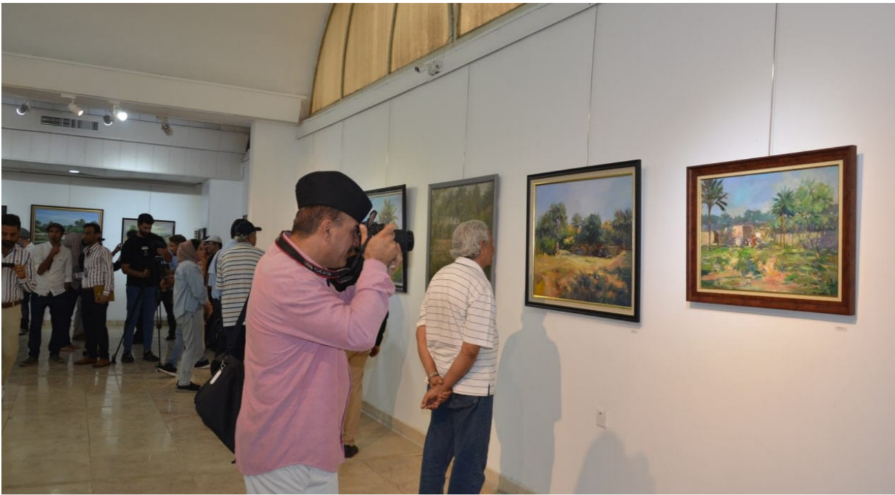
لوحات من معرض الطبيعة السنوي في دورته السابقة

من جفاف وقتل للحيوانات التي تعيش على مياه الأهوار فنجد الزورق في أرض مشرقه وبابسه لذا فإن معارض الطبيعة تغيرت في المرحلة الحالية ولا تشكل لون مهم وحيوي لتكون لها معالم فنية كبيرة مثلما كانت معارض الطبيعة في التسعينيات من القرن الماضي. وكان معرض الطبيعة الذي قدم في العام الماضي قد ضم أكثر من سبعين عملاً فنياً في الرسم . من أجيال وأساليب متباينة. بواقع عمل واحد لكل فنان. جميعها اختص بحكاية الطبيعة. حتى وان كانت قد تراجع مظاهرها إلا ان معارض الطبيعة تعد واجب جمالي ازاء الواقع كما انها تعطي فرصة للشباب لعرض مواهبهم وتجاربهم التي تصف الى جانب أعمال لرواد التشكيل العراقي واساتذة كليات ومعاهد الفنون لذا فمعارض الطبيعة تعرض لنا إحساس الفنان بالسياسات والصحارى والأهوار والجبال والغابات والسهول والحياة اليومية التقليدية المألوفة في الواقع كما ان البدعون يتألقون على سطوح اللوحات بحمة جمالية ويقروون الاشتغال عليها. وهذا ما حقق في معرض الطبيعة.