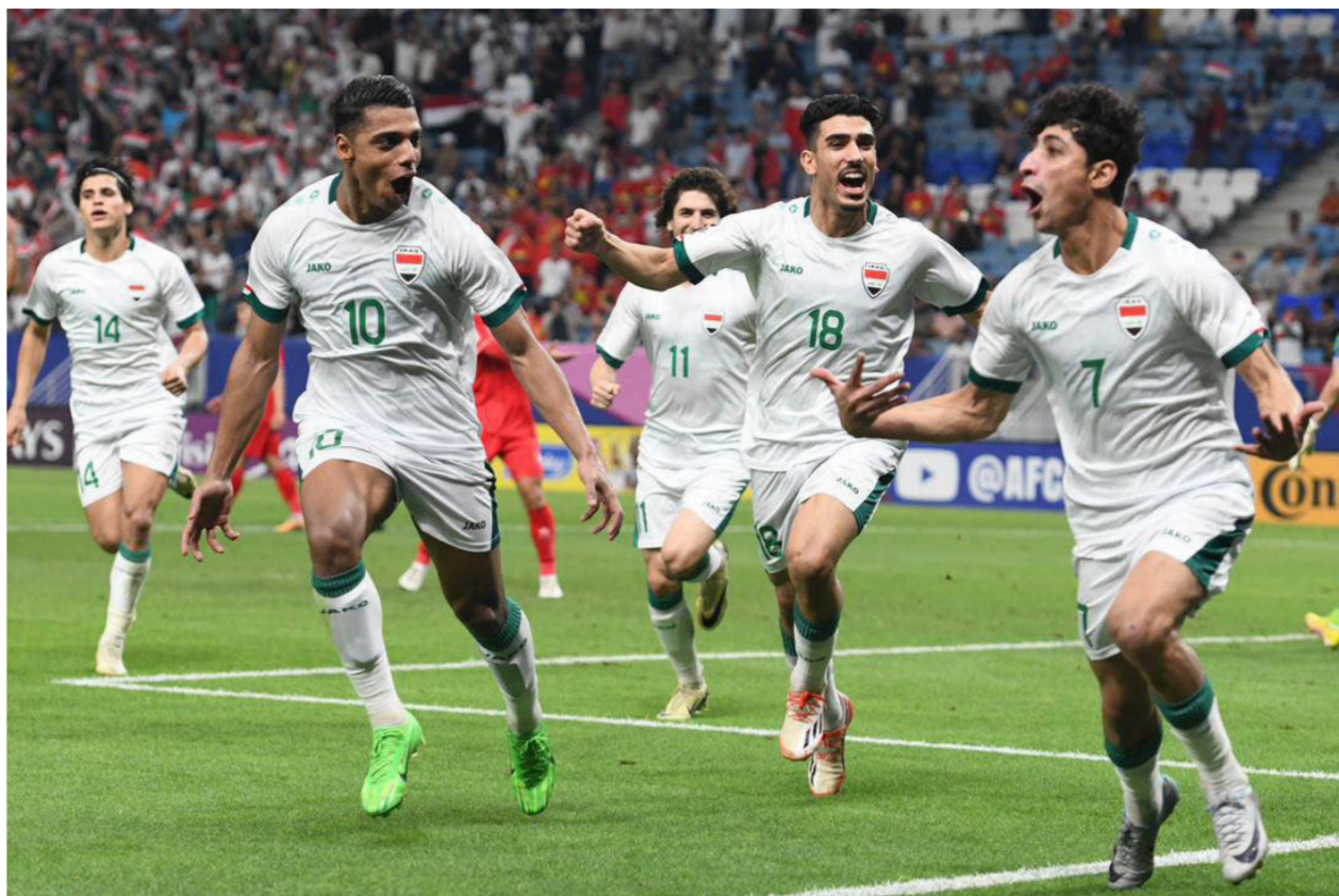
الأولمبي يواجه اليابان اليوم ببطموح الفوز

وأعرب نجم الكرة العراقية سابقاً يونس محمود عن ثقته باللاعبين والملاك الفني في اجتياز عقبة المنتخب الأولمبي الياباني والوصول إلى المباراة الأخيرة، والمنافسة على لقب بطولة كأس آسيا تحت سنن 23 عاماً الجارية فصولها بالعاصمة القطرية الدوحة. وأضاف محمود: إن كل المؤشرات تؤكد إمكانية التخرج بنتيجة إيجابية أمام المنتخب