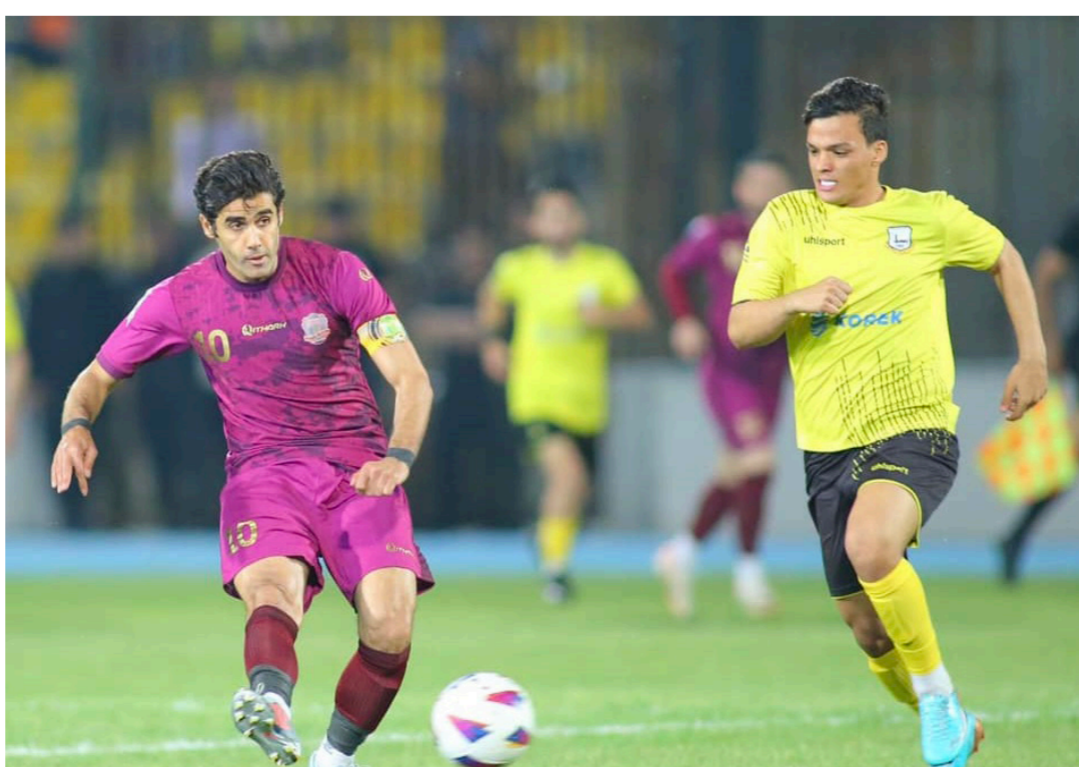
الشرطة يعزز صدارته لدوري نجوم العراق

وصل رصيد امانة بغداد الى النقطة 15 في المركز 19. ولم يتمكن فريق دهوك من استغلال عاملي الأرض والجوهر وخرج بتعادل إيجابي مع ضيفه نطق الوسط بهدفين لكل منهما. في المباراة التي جرت على ملعب دهوك وانتهى شوطها الأول بالتعادل الإيجابي أيضاً بهدف لكل منهما. وبهذا التعادل أضف كلاً الفريقين نقطة الى رصيدهما. ورفع دهوك رصيده الى النقطة 35 تراجع فيها الى المركز السادس. فيما رفع نطق الوسط رصيده الى 11 نقطة بقى فيها متديلاً للترتيب. وتمكن فريق النطق من قلب الطاولة على ضيفه فريق الحيدو وحقق فوزاً ثميناً بهدفين لهدف. في المباراة التي ضيفها ملعب الكرخ وبهذا النطق رفع النطق رصيده الى 36 نقطة ارتقى فيها الى المركز الخامس. فيما حافظ فريق الحدود على مركزه التاسع برصيد 32 نقطة. ورغم الخسارة. وتمكن فريق الكهراء من العودة الى الديار بنقطة مهمة. عندما فرض نتيجة التعادل السلبي من دون اهداف على المباراة التي جمعته بفريق نطق