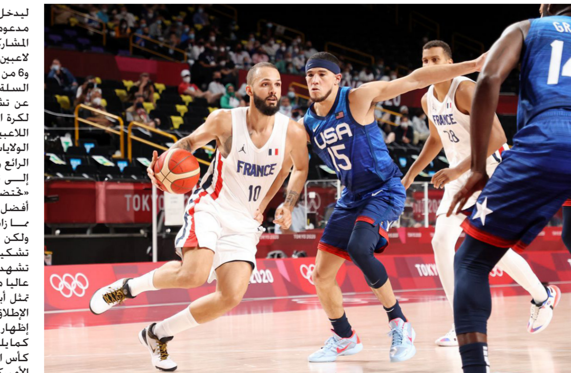
سلة اميركا في لقاء سابق

للدخول المنتخب الأمريكي الأولمبياد، مدعوما بخبرات 12 من الأبطال المشاركين في مباريات كل النجوم، و4 لاعبين حائزين على جائزة إم في بي، السلة، وقال هيل: "يشرفني الإعلان عن تشكيلة المنتخب الأمريكي لكرة السلة للرجال، وأشكر هؤلاء اللاعبين على التزامهم بممثل اتحاد الولايات المتحدة لكرة السلة، ومن الرائع رؤية حماس اللاعبين للانضمام إلى تشكيلة المنتخب"، وأضاف: "خضت الولايات المتحدة نخبة من أفضل لاعبي كرة السلة في العالم بما زاد من صعوبة عملية الاختيار، ولكن في نهاية المطاف أصبح لدينا تشكيلة قوي جدا"، وأضاف: "نتوقع أن تشهد دورة الألعاب الأولمبية مستوى عاليا من المنافسة، ولا سيما وأنها تمثل أبرز فعاليات رياضية عالمية على الإطلاق، مما يمنح منتخبنا فرصة إظهار مهاراته أمام العالم أجمع". كما يلتقي المنتخب الألماني الفائز بلقب كأس العالم لكرة السلة، مع نظيره الأمريكي المتوج بالميدالية الذهبية الأولمبية، مرة أخرى، في تموز 2024 في