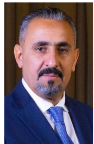
الشباب والرياضة من اجل التعاون الامثل لخدمه الواقع الشبابي والرياضي