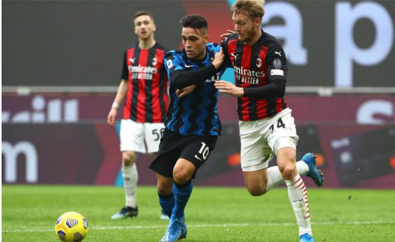
ميلان وأنتر في مواجهة سابقة

وافتححت الجولة أول امس بتعادل يوفنتوس وكاليفاري بهدفين لثلاثهما، وفاز لاتسيو على جنوي بهدف، فيما حل نابولي ضيفا على إمبولي وأوبينيي ضيفا على هيلاس فيرونا، ويلعب ساسولو مع ليتشي وتورينو مع فيورنتينا، ومونزا مع أتلانتا.