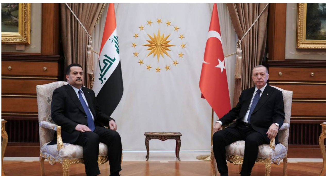
السوداني خلال لقائه أردوغان في زيارة سابقة

*العوادي: زيارة أردوغان تهدف لتصفير الأزمات بين البلدين