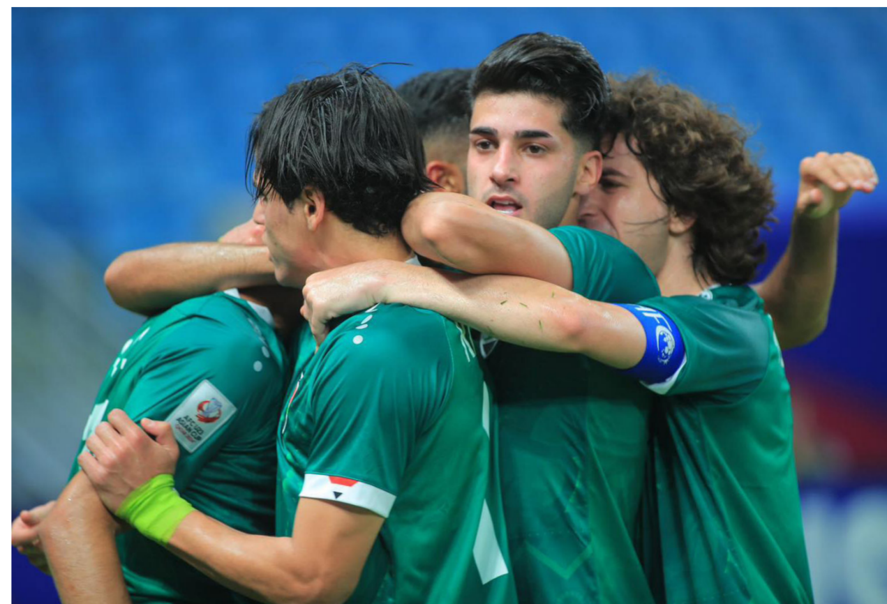
لاعبو المنتخب الأولمبي

إلى الدور الثاني. واختتم رئيس الاتحاد العراقي لكرة القدم حديثه بالقول: الفوز على طاجيكستان يتطلب منك مواصلة رحلة حصد النقاط على الرغم من قوة المنافس السعودي اليوم. ولكن التخطيط للدرب وحماستكم والالتزام بتطبيق الواجبات يمكنكم إسعاد شعبنا الكر.