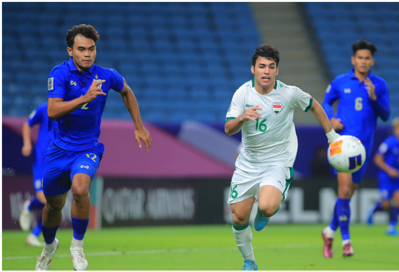
منتخبنا الأولمبي يخسر أمام تايلاند

وسيختتم منتخبنا مبارياته في المجموعة بقاء السعودية في الساعة السادسة والنصف من مساء يوم الاثنين المقبل الموافق 22 نيسان الجاري في استاد خليفة الدولي.