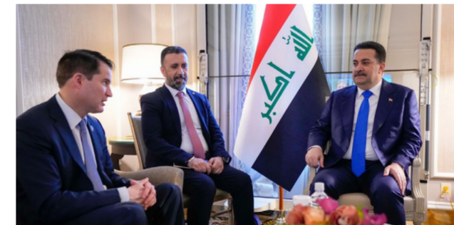
العلاقات الثنائية بين البلدين. وتوجه الحكومة العراقية نحو الانتقال بالعلاقة مع الولايات المتحدة إلى مستوى يتجاوز الجوانب الأمنية والعسكرية إلى مجالات أرحب في القطاعات الاقتصادية والتعليم والثقافية. وفي مجالات اتفاقية الإطار الإستراتيجي».

بغداد - الصباح الجديد: بحث رئيس مجلس الوزراء محمد شياع السوداني، أمس الأربعاء، مع رئيس التجمع الديمقراطي في مجلس النواب الأمريكي سيب مولتن، العلاقات الثنائية بين البلدين. وتوجه الحكومة العراقية نحو الانتقال بالعلاقة مع الولايات المتحدة إلى مستوى يتجاوز الجوانب الأمنية والعسكرية إلى مجالات أرحب في القطاعات الاقتصادية والتعليم والثقافية. وفي مجالات اتفاقية الإطار الإستراتيجي». وتابع أن «اللقاء شهد الأشادة بإجراءات الحكومة العراقية ونهجها في مجال الإصلاح وتدعيم الاقتصاد. وكذلك خطواتها في تعزيز جهود الأمن والاستقرار في العراق والمنطقة». وبين أن «اللقاء تناول الأحداث في غزة، والتأكيد على ضرورة إيلاف الحرب وحماية المدنيين العزل لاسيما الأطفال والنساء، بما يساهم في استقرار المنطقة وأمنها».