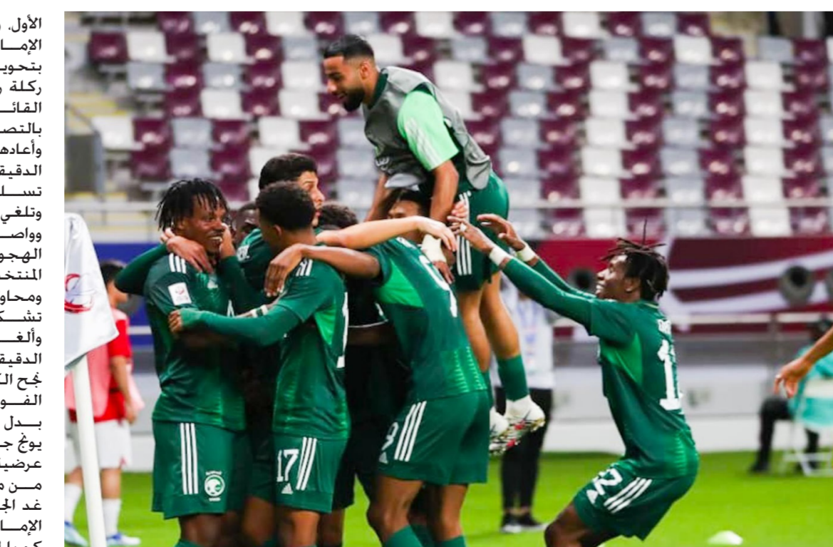
فرحة لاعبي السعودية بالفوز على طاجيكستان

الأول. وتصدى خالد توحيد. حارس الإمارات. لأولى الفرص الكورية. بتحويل ذفينة لسي كاج هي. إلى ركلة ركنية في الدقيقة 14. وتكفل القائم الأيمن للمرمى الإماراتي. بالتصدي لتسديدة هواج ميوج-وون. وأعادهما أن جاي-جون. إلى الشباك في الدقيقة 20. ولكنه كان في موقف تسلسل لتدخل تقنية الفيديو. وتلغي الهدف. وواصل منتخب كوريا الضغط الهجومي في الشوط الثاني. وقابله المنتخب الإماراتي بأداء دفاعي قوي. ومحاولات لشحن هجمات مرتدة لم تشكل أدنى خطورة على الرمي. وألقى الحكم هدفاً لكوريا في الدقيقة 87. بداعي التسلسل. ولكن نجح الكوريون أخيراً بتسجيل هدف الفوز في الدقيقة 4 من الوقت بدل الضائع. برأسية قوية من لي يوج-جون. بعد ركلة ركنية لعبت عرضية عالية. يذكر أن الجولة الثانية من مباريات المجموعة. ستقام يوم غد الجمعة. ويلتقي فيها منتخب الإمارات مع اليابان. والصين مع كوريا الجنوبية. وتتنافس منتخبات البطولة على إنهاء المشاركة في المراكز الثلاثة الأولى. للحصول