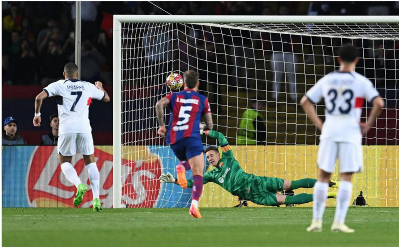
مبابي يسجل احدها اهداف الفوز في برشلونة

وأصبح لويس إنريكي أول مدرب سابق لبرشلونة يقضي الفريق الكاتالوني من أحد الأدوار الإقصائية لدوري أبطال أوروبا. فاز باريس سان جيرمان في مباراتين متتاليتين خارج أرضه في مراحل خروج المغلوب في دوري أبطال أوروبا للمرة الأولى منذ أبريل 2021. فنتشل برشلونة في تحقيق الفوز في 3 من آخر 5 مباريات له في دوري أبطال أوروبا. فنتشل برشلونة في تحقيق الفوز في 5 من آخر 7 مباريات في مراحل خروج المغلوب في دوري أبطال أوروبا. فنتشافي فشل في تحقيق الفوز في 10 من أصل 18 مباراة خاضها كمدرّب في دوري أبطال أوروبا. فنتشافي فشل في تحقيق الفوز في 16 من أصل 26 مباراة خاضها كمدرّب في المسابقات الأوروبية. فنتشل فنتشافي في تحقيق الفوز في 8 من أصل 13 مباراة خاضها على أرضه كمدرّب في المسابقات الأوروبية. كيليان مبابي شارك في 71 هدفا في 71 مباراة خاضها في دوري أبطال أوروبا. كيليان مبابي سجل 13 من آخر 21 هدفا لباريس سان جيرمان في الأدوار الإقصائية لدوري أبطال أوروبا. كيليان مبابي شارك بـ38 هدفا في 33 مباراة خاضها خارج أرضه في دوري أبطال أوروبا. كيليان مبابي سجل 15 هدفا في 12 مباراة خاضها خارج أرضه في الأدوار الإقصائية لدوري أبطال أوروبا.