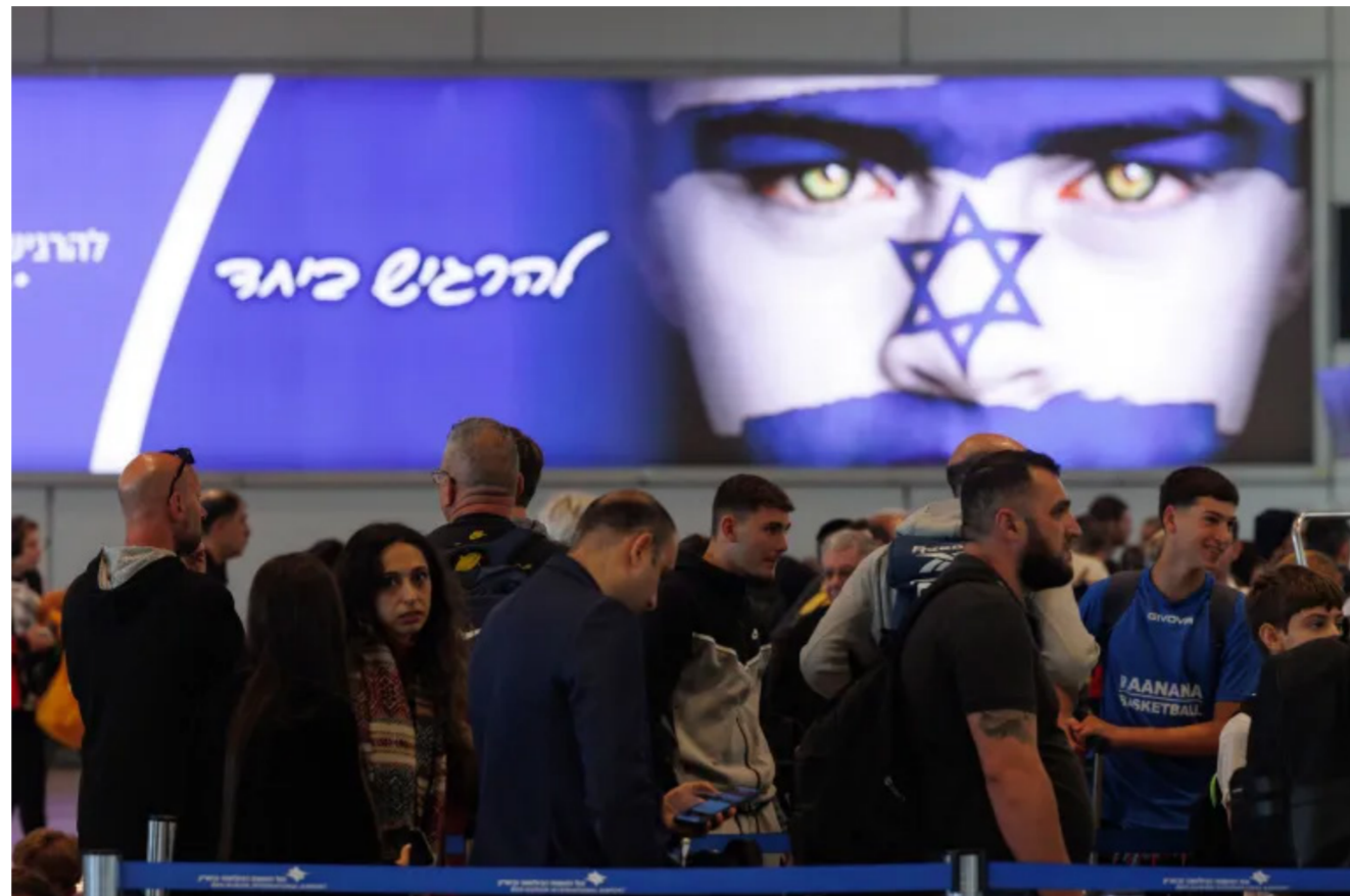
يرى محللون إسرائيليون أن إيران نجحت في إرباك بلادهم على مدار أسبوعين