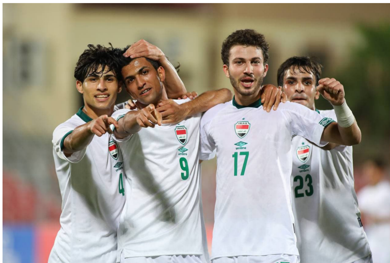
المنتخب الأولمبي في مشاركة سابقة

الأولمبية الدولية للخطوات الجديدة والفعيلة التي أقدم عليها المكتب التنفيذي للجنة الأولمبية لتحقيق رياضة الإنجاز العالي، فضلا عن الوعد الذي قدمه الدكتور توماس باخ، رئيس اللجنة الأولمبية الدولية، بزيارة العراق بعد انتهاء دورة الألعاب الأولمبية في باريس العام الحالي. وأضاف رئيس اللجنة الأولمبية الوطنية العراقية: إن المسؤولين على الرياضة العراقية وجهايرها الوافية يتفوق كثيرا مدربي ولاعبي المنتخب الأولمبي، لتقديم مستويات فنية رائعة والمنافسة بقوة وشرف لتحقيق أفضل النتائج والحصول على إحدى البطاقات المؤهلة إلى باريس عن قارة آسيا، واختتم الدكتور مفتن حديثه قائلا: إن اللجنة الأولمبية وفرت، على وفق الإمكانيات المتاحة، كل المستلزمات التي من شأنها أن تساهم في وصول المنتخب الأولمبي إلى دورة الألعاب الأولمبية، وهذا من صميم عملنا الذي ينصب على دعم جميع الأخذات الرياضية والمنتخبات الوطنية والفعاليات المختلفة.