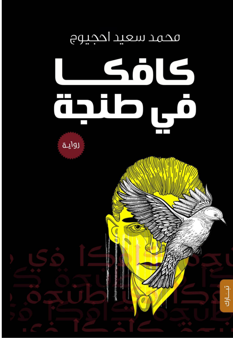
غلاف النسخة العربية من كافكا في طنجة

أحد شواطئ طنجة، متشجراً بالسواد، إلى رغبة الكاتب في جاوز التماثل بين بطلي الروايتين، إلى تماثل آخر بين شخصيته الجوربة وكافكا نفسه، وتشاركهما السوداوية ذاتها، والشعور ذاته بالاعتزاز والالتزام الذي عاشه الكاتب التشيكي على مدى حياته القصيرة. وعزز أحجيج محاكاته لنص كافكا عبر ما منح بطله «جواد» من سمات تشبه سمات «غريغور سامسا»، فكلاهما تخلى عن أحلامه من أجل إعالة عائلته، بعد أن تخلى الأب عن دوره في إعالتها، وإن لم يختر أبو «سامسا» هذا التخلي طوعاً، وإنما تعرض لخسارة جاراته، بينما هجر أبو جواد عمله، من دون أن يبالي بالنتائج، ما عزز من الصورة السلبية للأب، وأبرز حالة الاضطراب والنفعية التي وسمت العلاقات الإنسانية داخل أسرة البطل، وكسر الصورة النمطية للعائلة، عبر الخروج عن التعاطي المألوف معها كداعم ومنفذ لأنبائها: «فلنتحدث قليلاً عن الأب: عن رب الأسرة الذي اكتشف بغتة أنّ ثمة ربة أعلى منه، فتخلى عن ربوبيته جاء أسرته، وتفرغ لعبادة ربه العائد إلى الظهور... لو أسندنا مهمة وصف الأب إلى الابن الغاضب دائماً، لقال عن أبيه أنه نجيف كقلم رصاص، طويل كعمود إنارة، عنيد كحمار، عنيف كجلمود صخر حظه السيل من عل» ص 7.