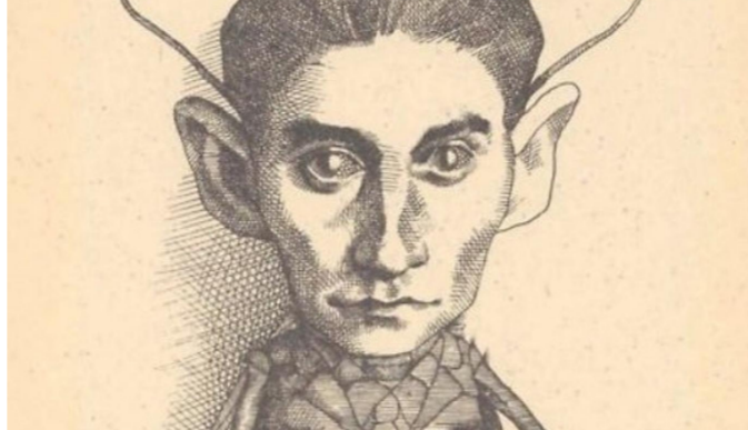
عندما رسم كافكا نفسه مسخاً

لجأ الكاتب إلى أسلوب مركزي للسرد، منح عبره سلطة الحكيم لراوٍ، ونقل هذه السلطة إلى أخت البطل «هنده» في غير موضع من النص. ليعلم عن معارضة ضمنية لثقافة تفرح المرأة وتسكت صوتها ويتيح لها التعبير عن هذا القهر والكشف عما يعتمل - كنتاج له - في عوالمها الداخلية، وقد غيّب صوت الشخصية الجوربة «جواد الإدريسي»، وأضفى هالة من الغموض والضبابية، على سلوكه الليلي بعد خوله إلى مسخ، ما سمح بكسر سكونية السرد، وإشراك القارئ عبر دفعه للتأويل والاستنتاج، وسد الفجوات السردية، وعزز أحجيج هذه الغاية في إشراك القارئ من خلال مخاطبته له في مستهل سرده، ليؤهله بذلك لتجاوز دوره الاعتيادي في التلقي، إلى الإسهام في صنع الحدث، وأيضاً ليحقق المزيد من التماهي مع نص امتزجت فيه الفانتازيا بالواقعية، وتداخل عبره الحقيقي والغرائبي، كذلك لعب الخلم في بداية النص، دوراً تهيئياً للأحداث، وعزز النزوع العجائبي للسرد، كما ربط الكاتب عبره بين عالمه الروائي، وعوالم كافكا، والذي أجال حضوره على